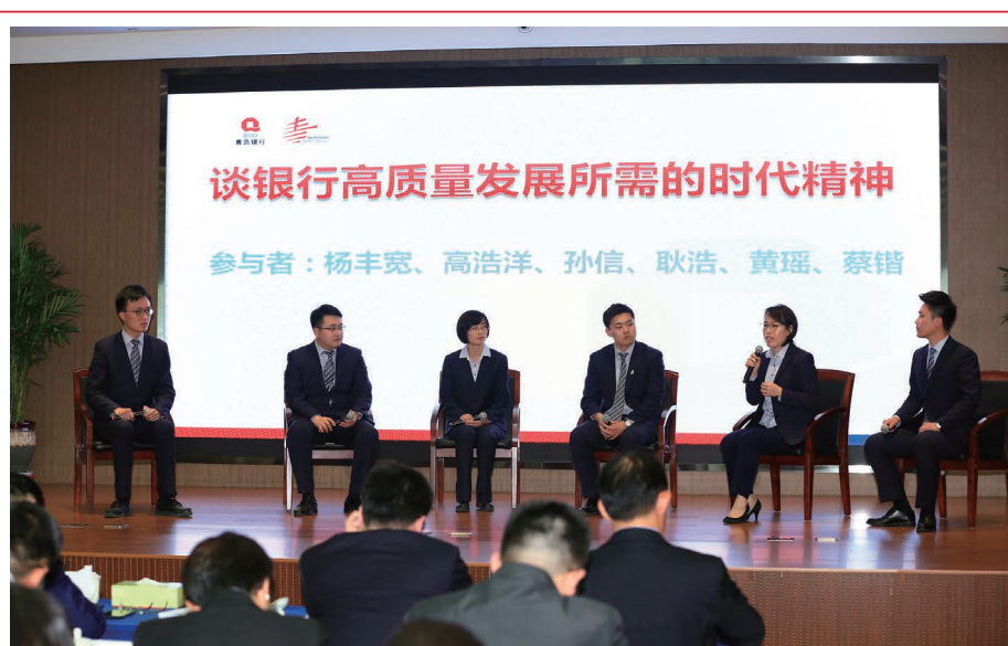
2018年5月，本行舉辦第五屆青年論壇。圖為本行員工進行專題討論。

結構化融資方面，本行深入市場進行調研分析，尋找有潛力的客戶及有價值的產品，營銷重點客戶、開拓重點領域，推動各類項目落地並實現收益。報告期末，本行結構化融資餘額220.30億元，同比下降7.47億元，降幅3.28%。