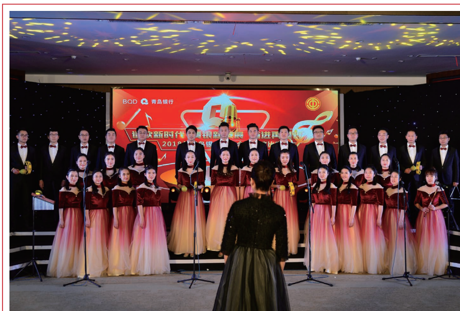
2018年12月，本行舉辦職工合唱比賽。