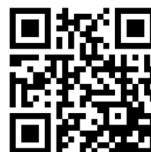
青島銀行 官方網站