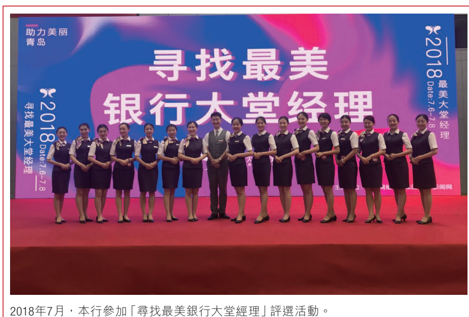
2018年7月，本行參加「尋找最美銀行大堂經理」評選活動。

報告期內，本行加速金融科技應用創新，深化科技與業務的雙向融合，採用極致、精益、敏捷的開發模式，不斷完善服務高效、互利雙贏的金融科技生態圈，實現金融科技賦能。本行共完成信用卡、智慧網點、票據業務、二三類賬戶一期、接口銀行新增功能、智能快櫃系統、櫃面無紙化、網聯清算平台接入、IFRS 9等46項重點項目的建設，有力支持了全行業務的飛速發展。