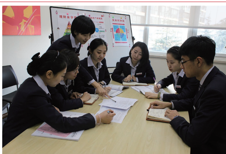
本行員工就「效能突破」項目進行討論。