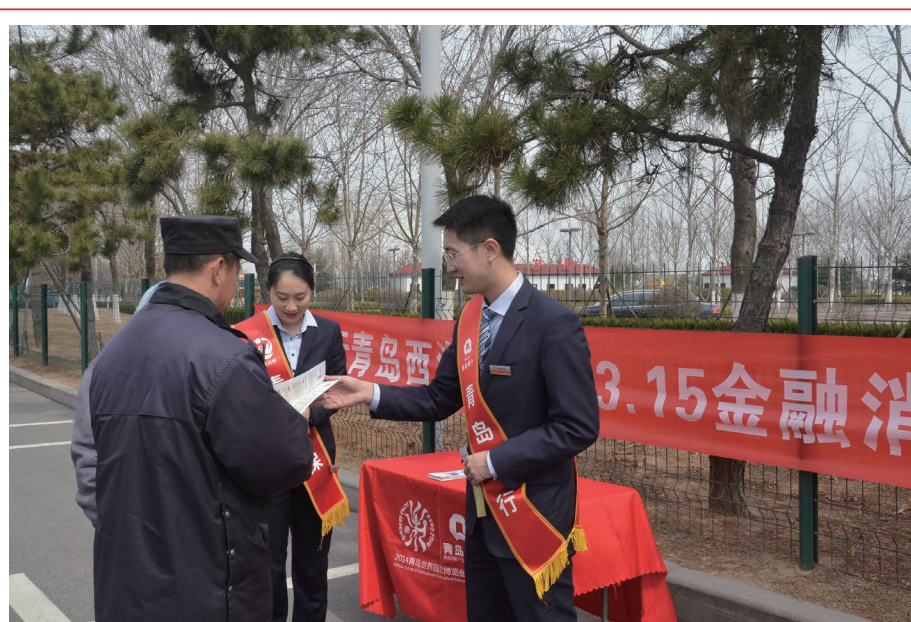
2018年3月，本行開展消費者權益保護主題宣傳活動。