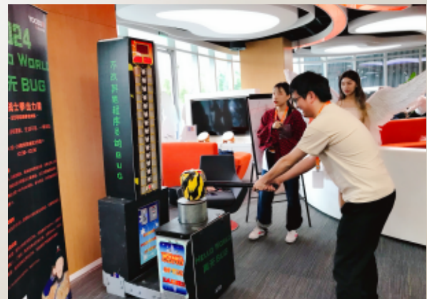
《1024 hello world 再无 BUG》 程序员节活动