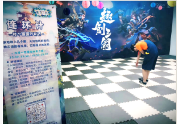
《趣创三国》儿童节活动