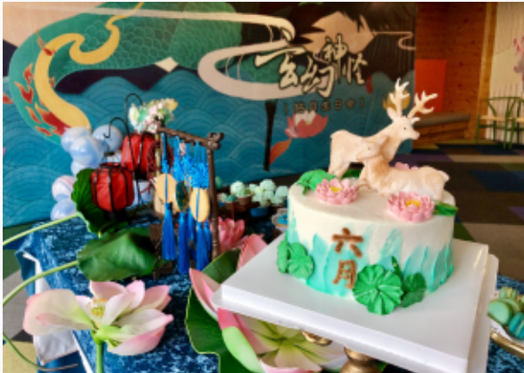
《玄幻神怪》系列员工生日会

游族网络通过结合传统节日、员工生日,打造了丰富多彩的公司活动,凭借创意十足的策划以及贴心多样的福利,全面提升了员工的雇佣体验。同时根据员工爱好以及流行热点,成立种类繁多的协会。让每位员工在工作之余,找到志同道合的伙伴,增强公司内部凝聚力、提升自身生活的乐趣。