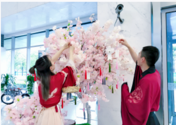
《土味桃话》七夕节活动