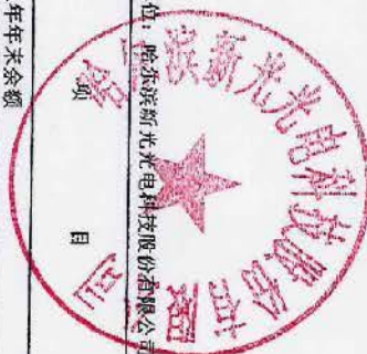
母公司股东权益变动表 (续)