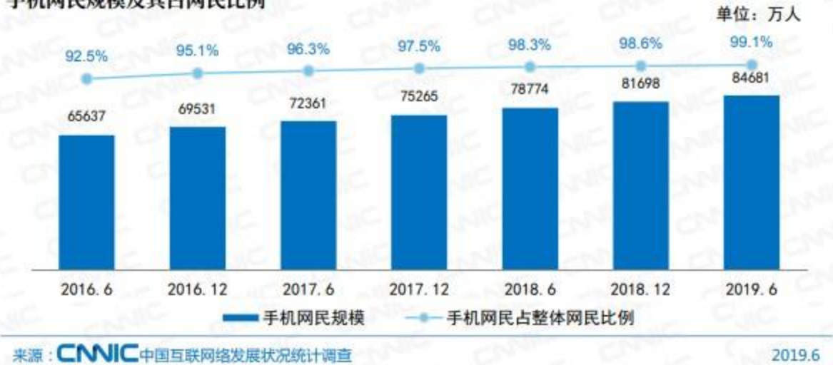
手机网民规模及其占网民比例

随着数字化进程的推进和数字经济的发展，我国互联网基础设施建设不断优化升级，互联网所能承载的服务愈来愈多，应用场景不断扩大。在此基础上，网民规模将持续增长，互联网渗透率不断提升，都为行业的发展带来了更大的想象空间。