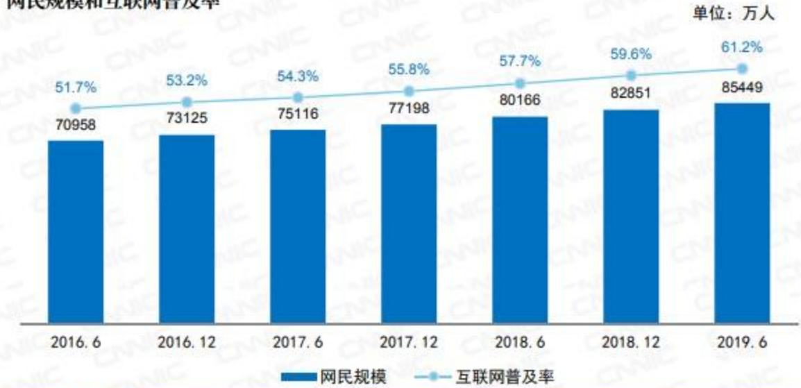
网民规模和互联网普及率

截至2019年6月，我国手机网民规模达8.47亿，较2018年底新增手机网民2,984万人。网民中使用手机上网人群的占比由2018年的98.6%提升至99.1%，网民手机上网比例继续攀升。如下图所示：