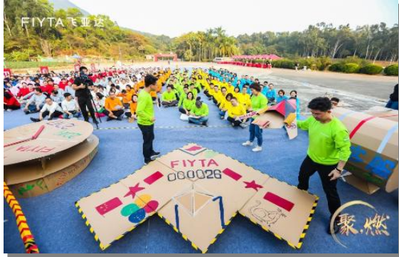
品牌群户外拓展训练

为进一步丰富和活跃员工业余文化生活，公司每年组织户外拓展训练、节庆文娱等活动，让员工拥有沟通表现舞台，增强团队凝聚力。