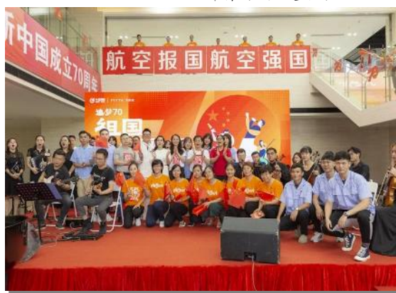
庆祝新中国成立 70 周年车间音乐会