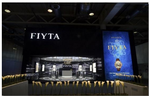
飞亚达参加巴塞尔钟表展

2019年，公司在努力做好经营的同时，继续不断传播钟表文化。亨吉利公司通过名表节的方式，分享和传播名表文化、時計文明和艺术。飞亚达表通过参加瑞士巴塞尔钟表展、香港钟表展及深圳钟表展，举办时光勋章盛典等方式在国内外传递腕表品牌与技术魅力。