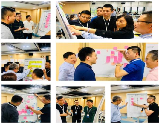
品牌群分公司总经理运营能力提升项目