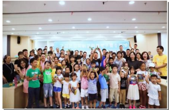
飞亚达航空科普亲子夏令营