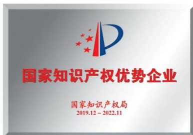
国家知识产权优势企业