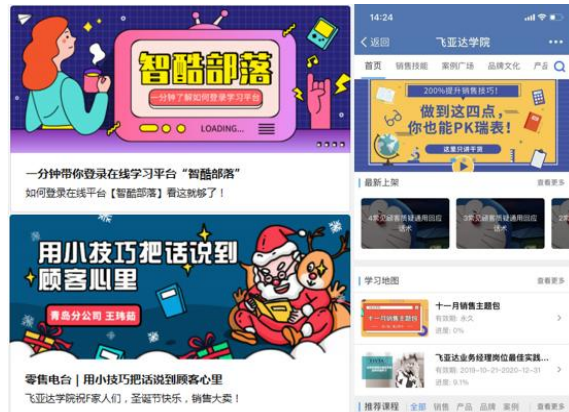
线上平台“飞亚达零售电台”项目