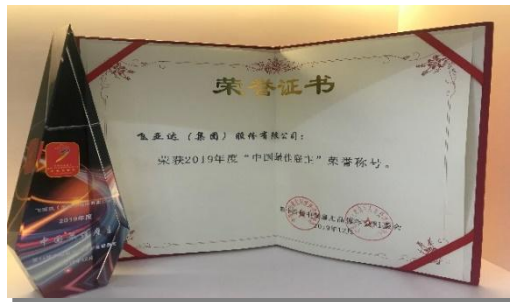
飞亚达“最佳雇主”荣誉展示

2019 年度，公司在“中国人力资源管理年度盛典”上连续十四次蝉联“中国年度最佳雇主”称号，公司始终不忘初心，牢记使命，在践行大国品牌的征途中为员工提供舞台，在雇主品牌建设的道路上砥砺前行。公司坚持在各大院校开展实习生招聘计划和新员工招聘计划，不断吸引优秀青年的加入。