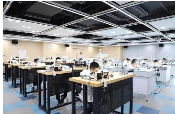
飞亚达公司维修技能竞赛