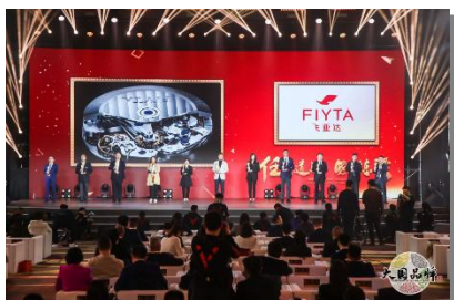
新中国成立70周年70品牌

公司自成立以来始终坚持依法诚信纳税，尽企业应尽的社会责任。2019 年，公司纳税额合计 2.63 亿元。报告期内，公司通过各方面不断努力，赢得了社会各界的广泛认可，荣获“新中国成立 70 周年 70 品牌”、“国家知识产权优势企业”、“人民网 2019 年度匠心品牌”、“深圳知名品牌”、“深圳行业领袖百强企业”等奖项及称号。