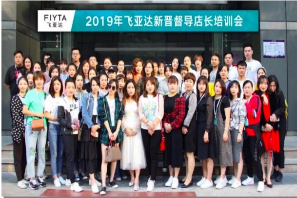
飞亚达 2019 年督导店长培训

建立人才发展体系，聚焦核心专长培育，以飞亚达学院为平台，建立领导力、零售、品牌及顾客管理等培养的完整培训、认证体系，长期培养业务领军人才、快速引进战略新兴人才、有效留用关键岗位人才。