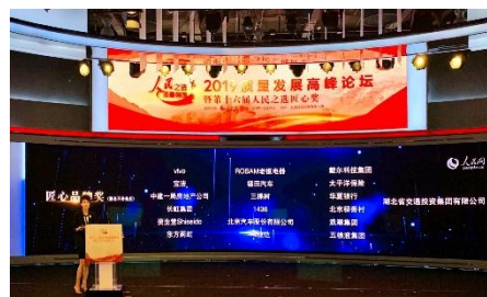
人民网2019年度匠心品牌