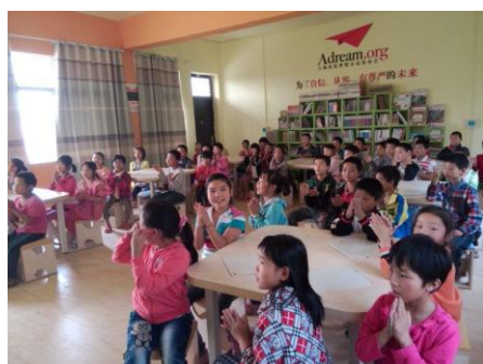
飞亚达“梦想中心”项目