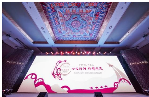
飞亚达时光勋章盛典

报告期内，深圳市领导多次莅临飞亚达计时文化中心。此外，计时文化中心获评深圳市科普教育基地、深圳市工业展馆联盟副理事长单位、南山儿童科普联盟成员单位，并加入深圳市科普教育基地联合会，成为全市公民学习了解腕表文化、了解工匠精神的重要课堂。