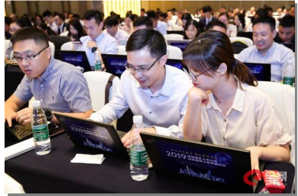
深圳辖区上市公司 2019 年度投资者网上集体接待日”大型活动