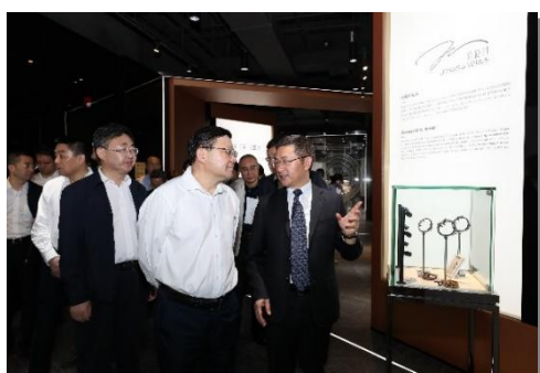
深圳市委书记王伟中莅临参观

报告期内，深圳市领导多次莅临飞亚达计时文化中心。此外，计时文化中心获评深圳市科普教育基地、深圳市工业展馆联盟副理事长单位、南山儿童科普联盟成员单位，并加入深圳市科普教育基地联合会，成为全市公民学习了解腕表文化、了解工匠精神的重要课堂。