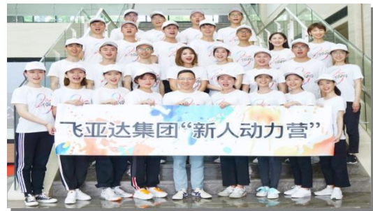
飞亚达 2019 年新员工风采