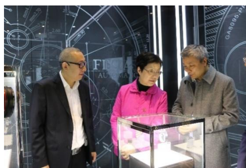
深圳市办公厅主任裴蕾莅临参观