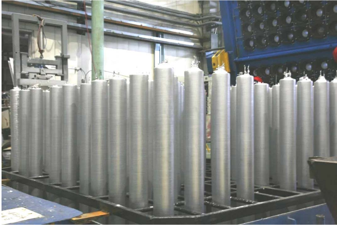
2019 年 8 月 3 日，合金材料分公司成功开发出新产品高附加值 6A63 合金棒

请专利 286 件，其中发明专利 160 件，实用新型专利 124 件，外观设计专利 2 件；累计授权专利 168 件，其中发明专利 66 件，实用新型专利 100 件，外观设计专利 2 件。