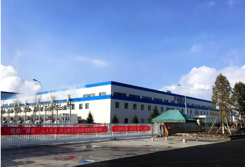
新疆众和石河子产业园