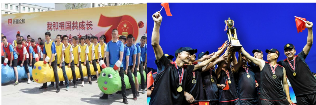
2019年6月22日，“我和祖国共成长、迎接新中国成立70周年”员工田径拔河趣味比赛、第十四届篮球、第九届乒乓球、第五届羽毛球赛

秉持“发展依靠员工，发展成果与员工共享”理念，公司全年开展员工年度健康体检近 3000 人，全面建立员工健康服务管理体系，推动员工日常健康跟踪服务管理制度，开展员工健康、心理咨询服务；做好退休办服务管理工作，全面完成 900 余名退休人员社会统筹、各项报销、年度报刊、特殊困难、重大疾病住院、去世的关心帮助，制度化开发管好退休活动室，落实节假日福利，使老有所依、老有所乐工作见实效。