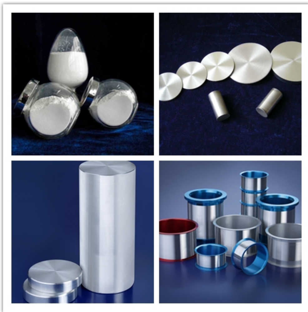
公司高纯铝精深加工产品

现了稳定供应市场，得到了下游客户的认可；高纯铝基键合丝母线生产技术不断改进，可应用于集成电路，包括民用及工业 IC；公司拥有行业先进水平的高纯氧化铝生产技术，产品纯度达 5N 以上，高纯氧化铝粉体作为蓝宝石单晶制备原料，广泛应用于 LED 衬底、航空航天、高强度激光器、手机、手表、智能可穿戴设备等领域；公司不断研发高合金化铝合金，产品拥有高硬度、高强度、良好的耐磨性等优良特性，可广泛应用于航空航天、大飞机制造、轨道交通等领域。