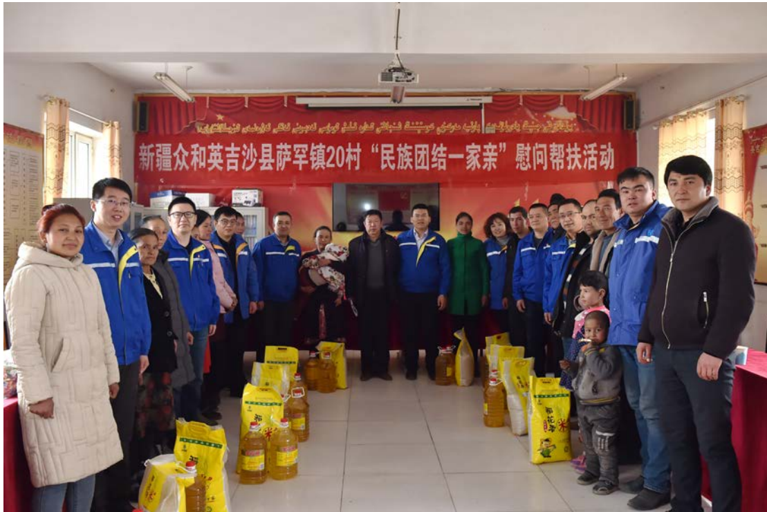
2019年3月2日，新疆众和英吉沙县萨罕乡20村“民族团结一家亲”慰问帮扶活动现场

村”行动，落实“民族团结一家亲”工作，建立帮扶长效机制，因地制宜，从实际出发，发挥地域特点和优势，大力推进“精准扶贫”。新疆喀什英吉沙县萨罕乡夏甫阔罕村为公司定点帮扶村，公司通过提供产业扶贫、教育扶贫、提供技能培训帮助稳定就业、捐资助学、提供生活用品和农用物资等多种途径，帮助贫困村拓宽致富门路，改善生产生活条件，增强自身发展能力，早日实现脱贫致富。