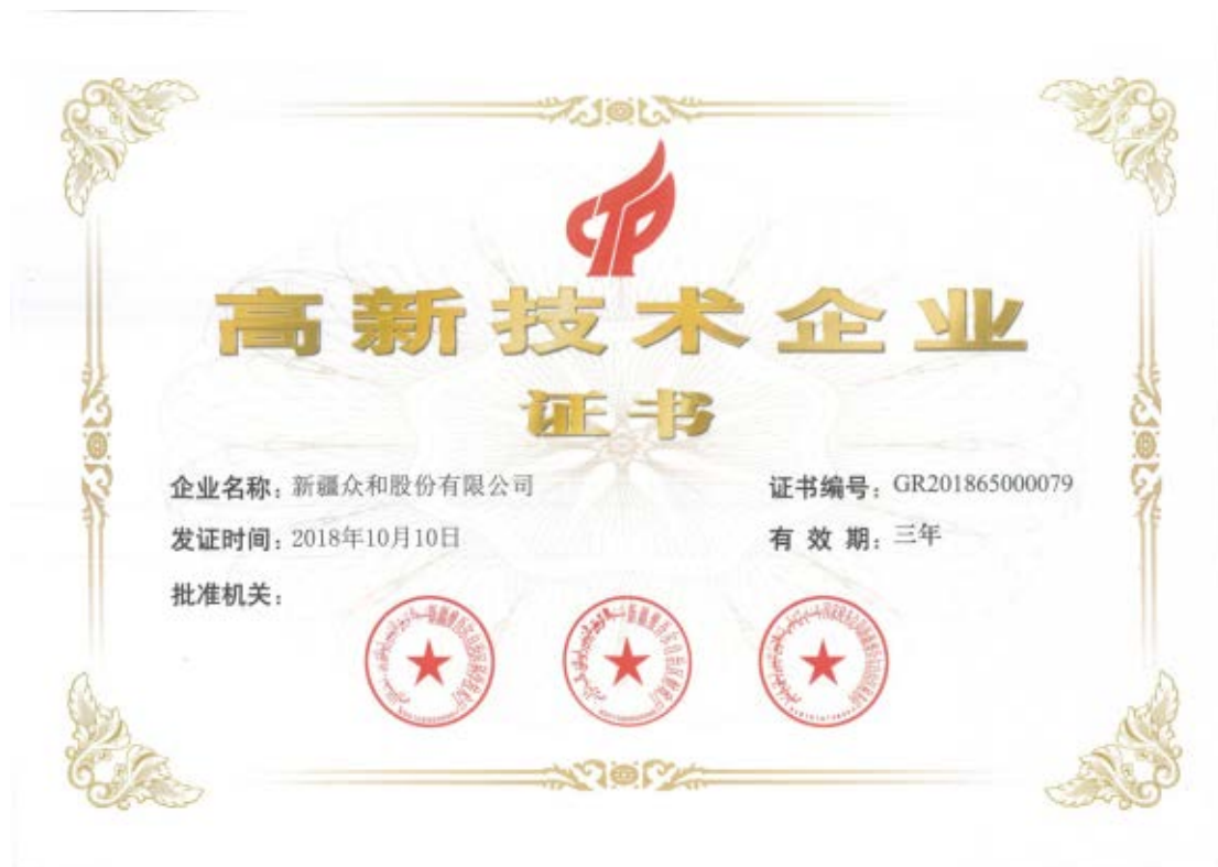
新疆众和荣获高新技术企业证书

课题和领跑工程；培养了一支以院士、国内外知名专家为核心的人才队伍；公司与东北大学、北京科技大学、中南大学等高校院所建立了产、学、研、用的长效合作机制，为铝基结构型、功能型材料尖端产品研发和生产提供了有力支持。