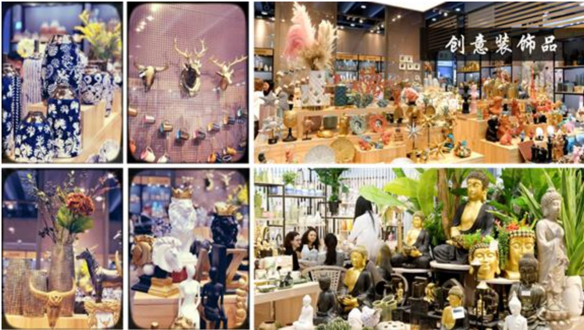
(图1：公司设计的创意装饰品产品图片)

1、创意装饰品： 在创意装饰品的研发设计理念上，公司主要通过文化创意和设计服务将中华传统文化或外国经典元素融入陶瓷、树脂、竹木、铁件等载体之中来突显创意特性，并运用现代的工艺技术制造而成，主要可分为节庆装饰品、日用装饰品及花园装饰品等。