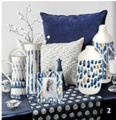
(图4：传统文化与现代文创工艺的结合)

中西方设计思潮的碰撞和交流极大地丰富了创意和设计内涵，拓展了物质和非物质文化遗产传承和发扬途径，促进了文化资源的应用和发展。