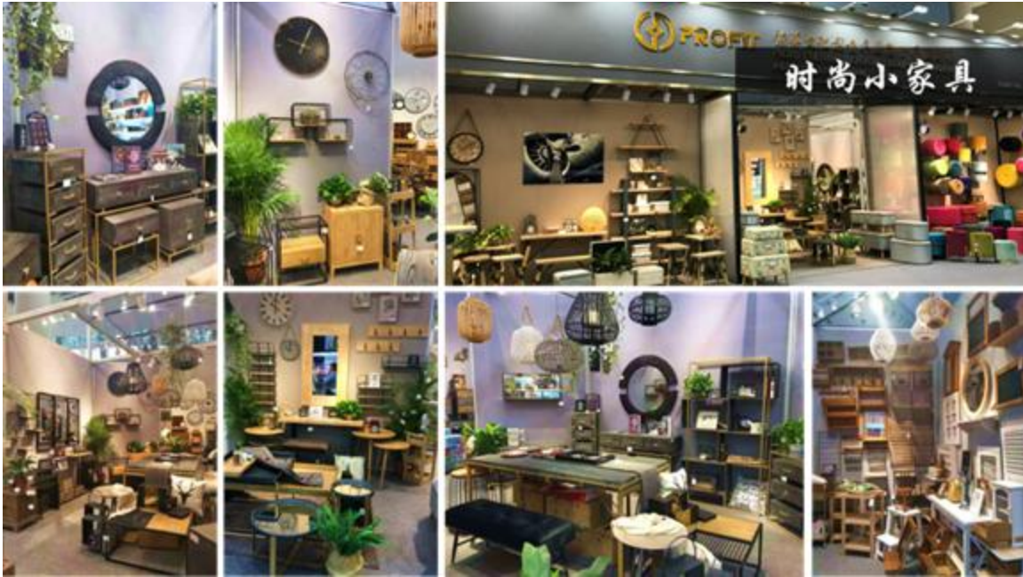
(图 3：公司设计的时尚小家具产品图片)

设计上融合设计师的创新和灵感，融入时尚、品质、文化及个性化元素，满足消费者对生活环境和生活品质的高层次要求。