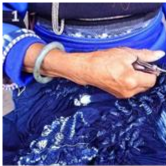
1. 中国传统扎染技术； 2. 德艺文创根据该传统技术设计的产品。

作为以中国五千年的传统文化为创意来源的企业，德艺文创深扎于文化土壤，并以此为创意设计的来源，重点开发呈现具有文化特色的家居产品。举例来说，中国古老的扎染技术，其方式是通过结扎织物，浸泡染色，被结扎的部位无法着色，最后得到很不规则很自然图案的布料，是国内传统独特的手工染色技术。研发设计团队从其中获取创意设计思路，进行二次升级改进，与当下流行的中东北非异域图腾符号糅合，匹配以流行的土豪金画龙点睛手法，诠释到材料载体上。