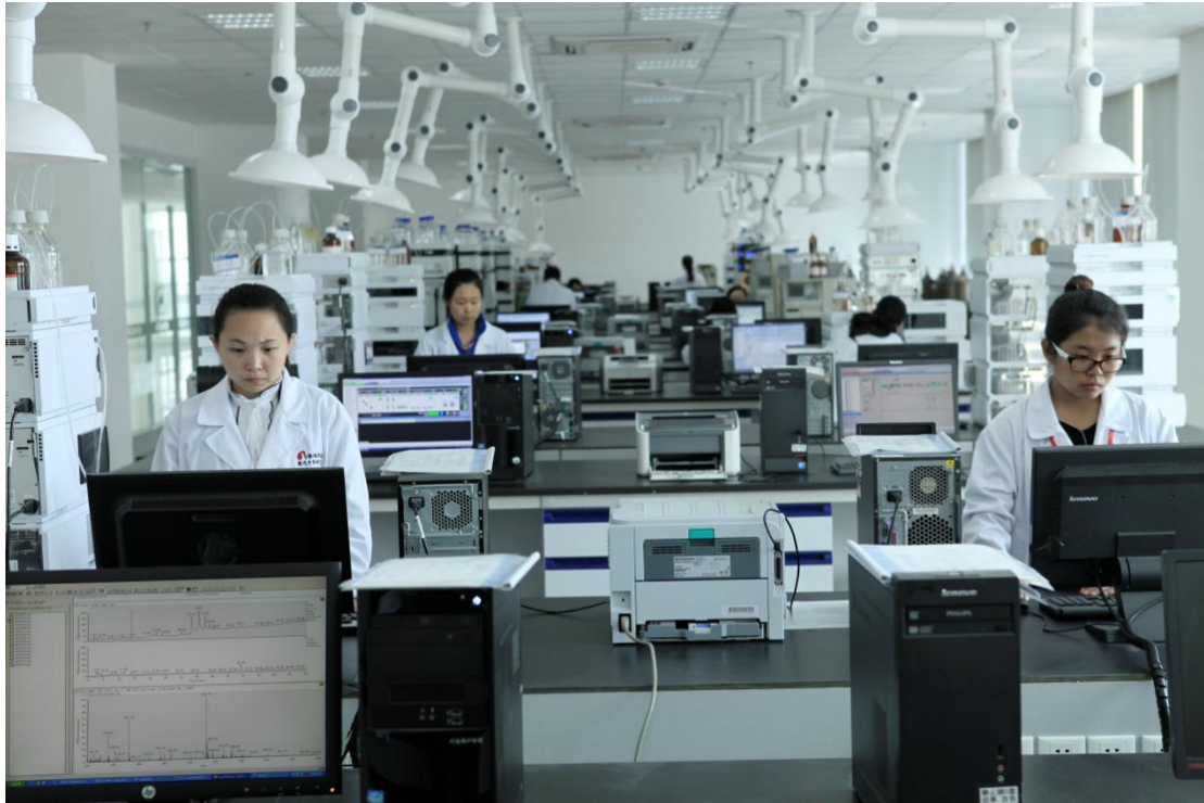
康缘现代中药研究院药物分析实验室