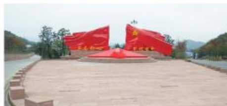
遵义苟坝红色文化旅游创新区建设项目