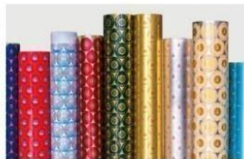
复合型防伪印刷铝板