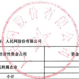
2019年度非经营性资金占用及其他关联资金往来情况汇总表