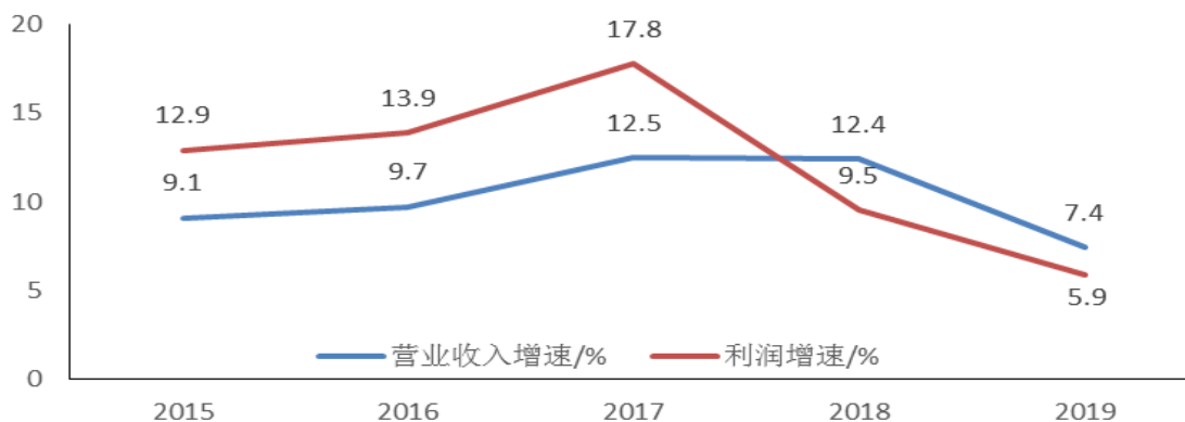
近5年规模以上医药制造业营业收入与利润增速

备注：1、2015年、2016年为主营业务收入和利润总额增速；其余年份为营业收入和利润总额增速；