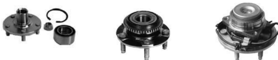
本公司第一、二、三代汽车轮毂轴承单元图示

截至目前，公司已累计开发各类型号的汽车轮毂轴承单元超过3800余种，覆盖了世界上包括奔驰、宝马、奥迪、福特、通用、克莱斯勒、大众、本田、丰田、标致等在内的主要中高档乘用车、商用车的车系车型。