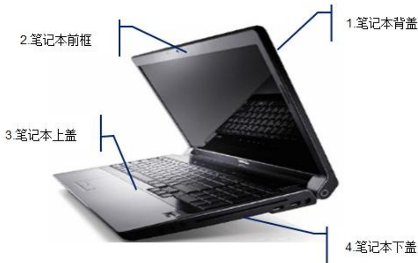
图：笔记本外壳示意图

公司为主流消费电子产品厂商提供精密结构件模组产品，其中以笔记本电脑结构件模组为主。笔记本电脑结构件模组包括四大件：背盖、前框、上盖、下盖以及金属支架，上述结构件模组在装配笔记本电脑过程中需容纳显示面板、各类电子元器件、转轴等部件，其结构性能对制造精密度提出了较高的要求。同时由于其还具有外观装饰功能，故该产品对生产企业的设计能力亦有较高的要求。