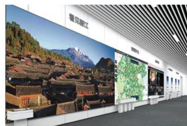
数字云南展示中心