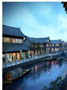
河南漯河天明戏曲文化园