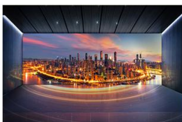
重庆国际物流枢纽规划展示馆