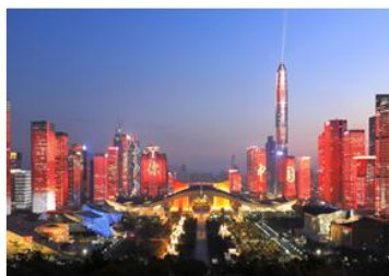
深圳福田CBD城市灯光秀