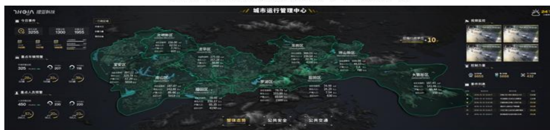
城市运行管理系统