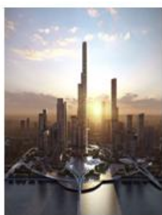
深圳湾超级总部基地