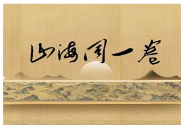
“一带一路” 国家合作高峰论坛