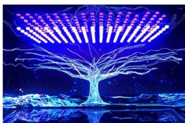
国家电网江苏电力体验馆