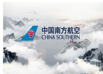
中国南方航空空客安全演示片