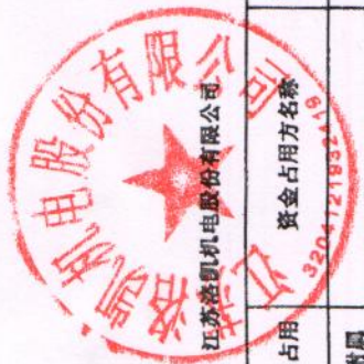
2019年度非经营性资金占用及其他关联资金往来情况汇总表