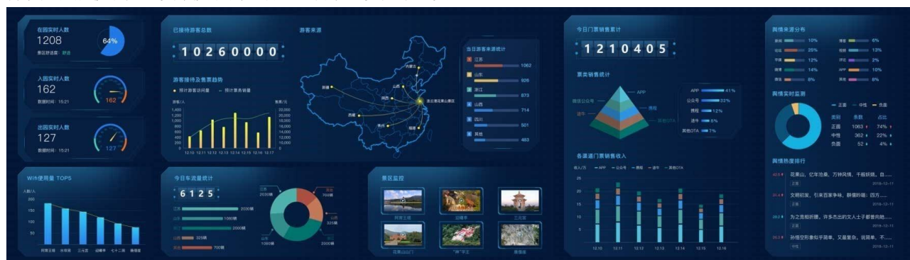
（图为路通视信智慧旅游大数据平台）

该业务依托控股子公司路通物联，面向景区、旅游监管部门及其他涉旅商企，提供景区网络规划、数据融合服务、景区智能化建设、商业系统整合、游客服务系统建设、全网营销平台建设的综合解决方案，其中，核心软件产品“智慧旅游云平台”涵盖了景区综合管理、游客一站式服务、智慧旅游全网营销三大功能，既可为景区提供架构完整、灵活性强、集管理、服务、营销功能于一体的综合解决方案，又可基于海量数据为旅游监管、推广、指挥调度提供有力手段。报告期内微山湖景区、江苏某5A级景区、西安回民街等多个智慧旅游全域/全场景项目的综合实践，进一步验证了产品的市场成熟度，为公司持续开拓规模较大、复杂度较高的智慧旅游项目奠定了坚实基础。