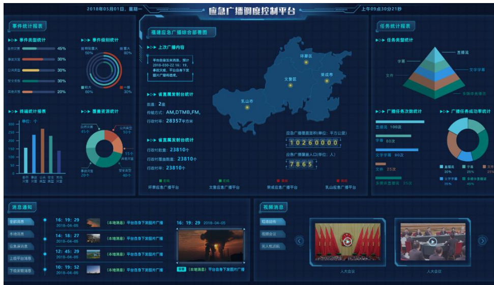
(图为路通视信应急广播调度/播控一体化平台)