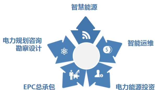
图1 永福股份主要业务

公司在做优做强传统业务的基础上，重点推行“两源两海”业务策略，即智慧能源、综合能源、海外市场、海上风电。在智慧能源领域，开发完成生产协同系统、基于全景信息模型的智能运维系统、智能电网设计配置一体化平台、基于电力物联网的信息安全、云平台、4G/5G无线通信集成解决方案等产品，可提供相关产品与服务，正快速构建营销体系，加大市场推广力度，未来将在网络安全、数字储能电站、数字海上风电等方面加大研发投入，快速提高智慧能源业绩；在综合能源领域为客户提供分布式能源、多能互补、能效提升、用能监测、需求响应以及综合能源一体化管理系统等多类型组合在一起的综合能源技术解决方案和服务产品，其中，在储能领域大力开拓覆盖电网侧、用户侧和电源侧的储能电站业务，涉及包括大型储能电站、风光储联合开发、微电网、光储充一体化开发等项目类型，具备大型储能电站和分布式储能的规划咨询和项目实施的系统开发能力和集成能力；继续发挥海外市场的商业模式优势和海上风电的技术优势，持续扩大业务规模；同时，积极扩大电力物联网、特高压和充电桩等“新基建”领域市场规模，通过全产业链资源整合和投资驱动快速发展。