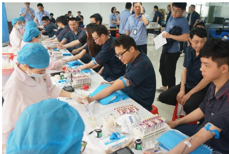
图 20 献血活动现场图

献血量达 1.6 万多毫升，为拯救生命献出了微薄之力，展示出广日人关爱他人、奉献社会的精神风貌。