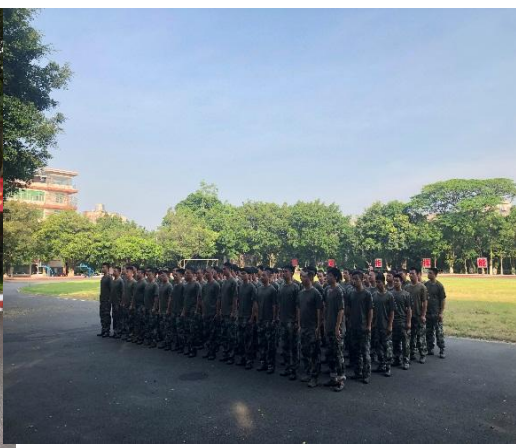
图10 学生军训动员大会