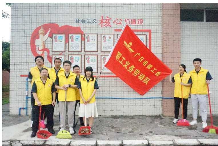
图 21 义务劳动现场图

2019 年 6 月，公司组织了多名志愿者到石楼岳溪村何澄溪小学进行义务劳动，在学校打扫卫生、整理图书，为师生营造了良好学习环境。