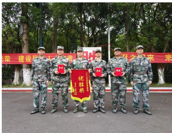
图9 民兵应急连集训考核

在国防后备力量整顿、民兵任务开展工作中，各子企业积极参与组建公司30人编制综合救援连、配合相关部门开展扫黑除恶专项斗争、完成越秀区人民武装部应急连集训考核、“八一”期间拥军优属、2019年夏秋季征兵、“羊城天盾-2019”人防演练、重阳节白云山防火执勤任务等工作。