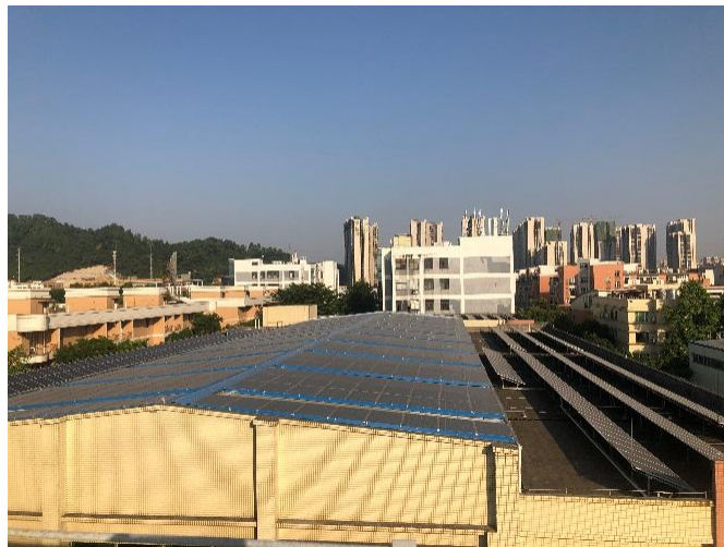
图 14 厂房屋顶并网型太阳能光伏发电工程一期（550KW）

公司智能装备制造产业积极响应国家号召，旗下松兴电气经申报获批准在现有厂房屋顶建设总规模 600KW 的并网型太阳能光伏发电工程。其中一期(550KW)工程于 2019 年 6 月底完工并实现并网发电，与 2018 年相比，2019 年节省电费 14 万元；60KW（二期）宿舍光伏工程将于 2020 年完成。企业屋顶安装光伏电站后实现太阳能、建筑的综合利用，不仅让企业达到节能减排的效果，也尽到了改善周边环境的社会责任。