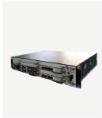
插卡式 BBU XWB7500