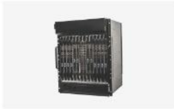
接入汇聚与集群软交换设备