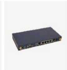
室内型 CPE BL7460