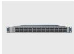
SSDevice--iDirector 7048 汇聚分流设备