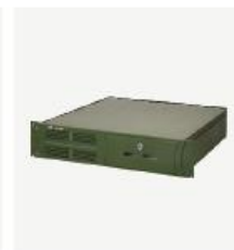
企业级核心网产品 TCN1000R