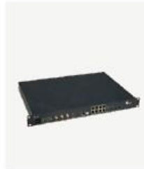
单板式 BBU XWB6400