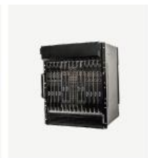
运营级核心网产品 TCN2000