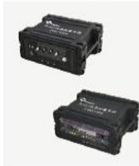
分体式快速部署系统 SRD1000