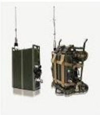
多媒体背负式终端 MBT 系列