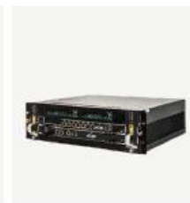
企业级核心网产品 TCN1000E