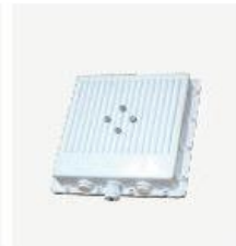
室外型 CPE BL8410