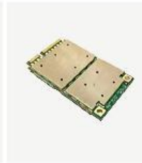
Mini PCI-E 接口嵌入式模块 MPE168