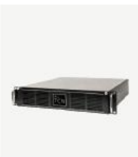
企业级核心网产品 TCN1000