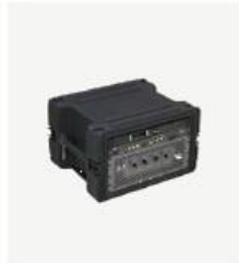
一体化快速部署系统 SRD2000