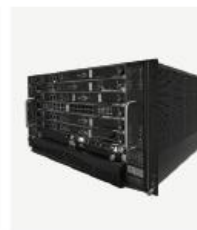
运营级核心网产品 TCN2000S