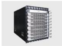
SSDevice--iDirector 13C 汇聚分流设备