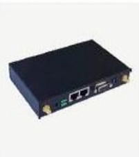
MEM 模块 MEM130