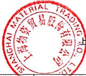
上海物资贸易股份有限公司2019年度非经营性资金占用及其他关联资金往来情况表