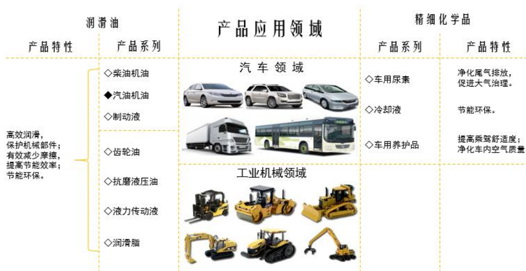
发行人主要产品及应用领域示意图

目前，发行人车用环保精细化学品主要包括发动机油、齿轮油、抗磨液压油等润滑油产品，以及发动机冷却液、柴油发动机尾气处理液、车用养护品等。