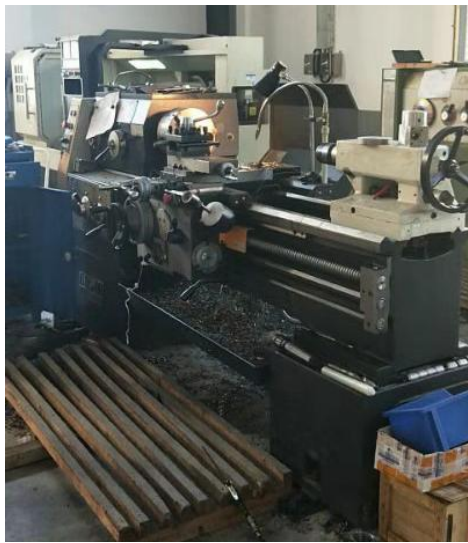
3. 数控车床 2 台；主要功能雷同于普通车床，是数字控制化的自动车床。