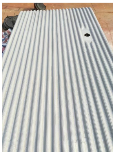
图2 HCMT冷焊加工后的管排