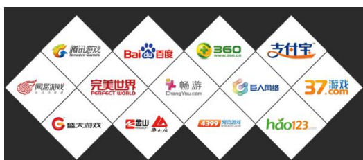
图4武汉飞游部分合作客户

同时长沙聚丰2019年开始新增互联网广告代理业务，该类业务中公司一般先代客户进行充值，约定期限内向客户收取充值代垫款项。长沙聚丰已签约代理广点通、今日头条等多个，广点通是国内知名的互联网广告业务平台，汇集腾讯网、腾讯mini窗、腾讯新闻客户端、腾讯视频、天天快报、QQ音乐、微信、QQ空间、QQ浏览器、应用宝、第三方应用等丰富广告场景，覆盖PC端和移动端的android、ios两大系统。