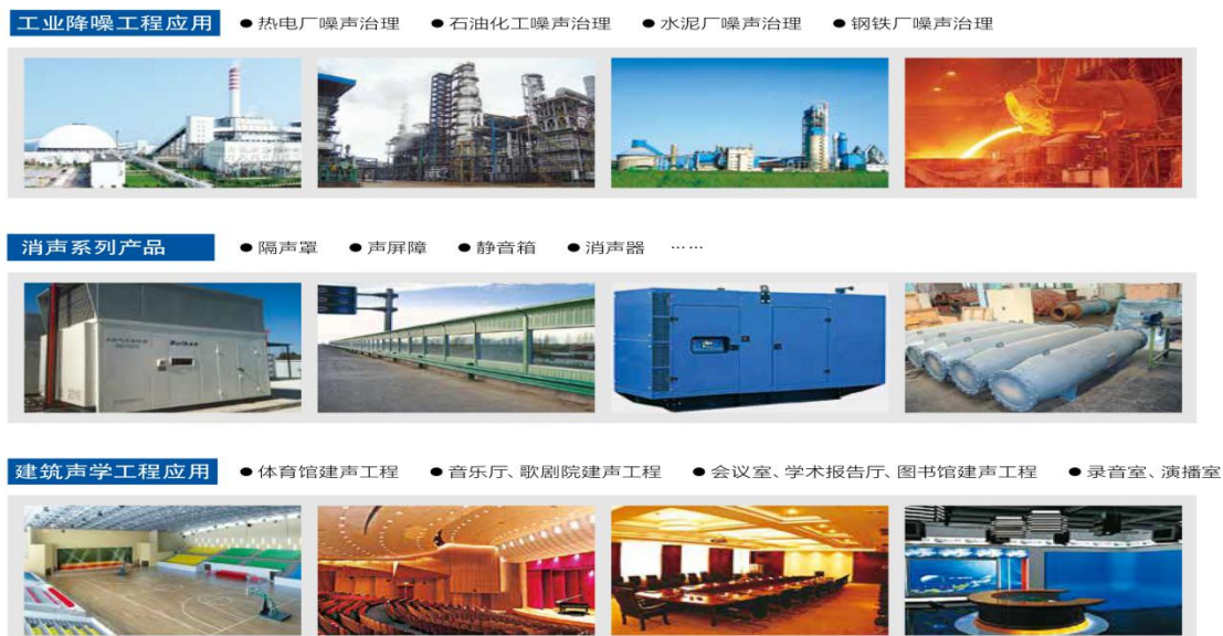
图3 声学降噪业务涉及到的领域

声学降噪产业作为环保产业的一个分支，通过声学设计、声学新材料、声学新技术在工业、交通、建筑、社会生活等行业领域应用，采取隔声、吸声、消声、隔振等措施，控制噪声源的声输出，控制噪声的传播和接收，以得到人们所要求的声学环境。