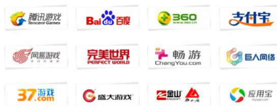
图5长沙聚丰部分合作客户