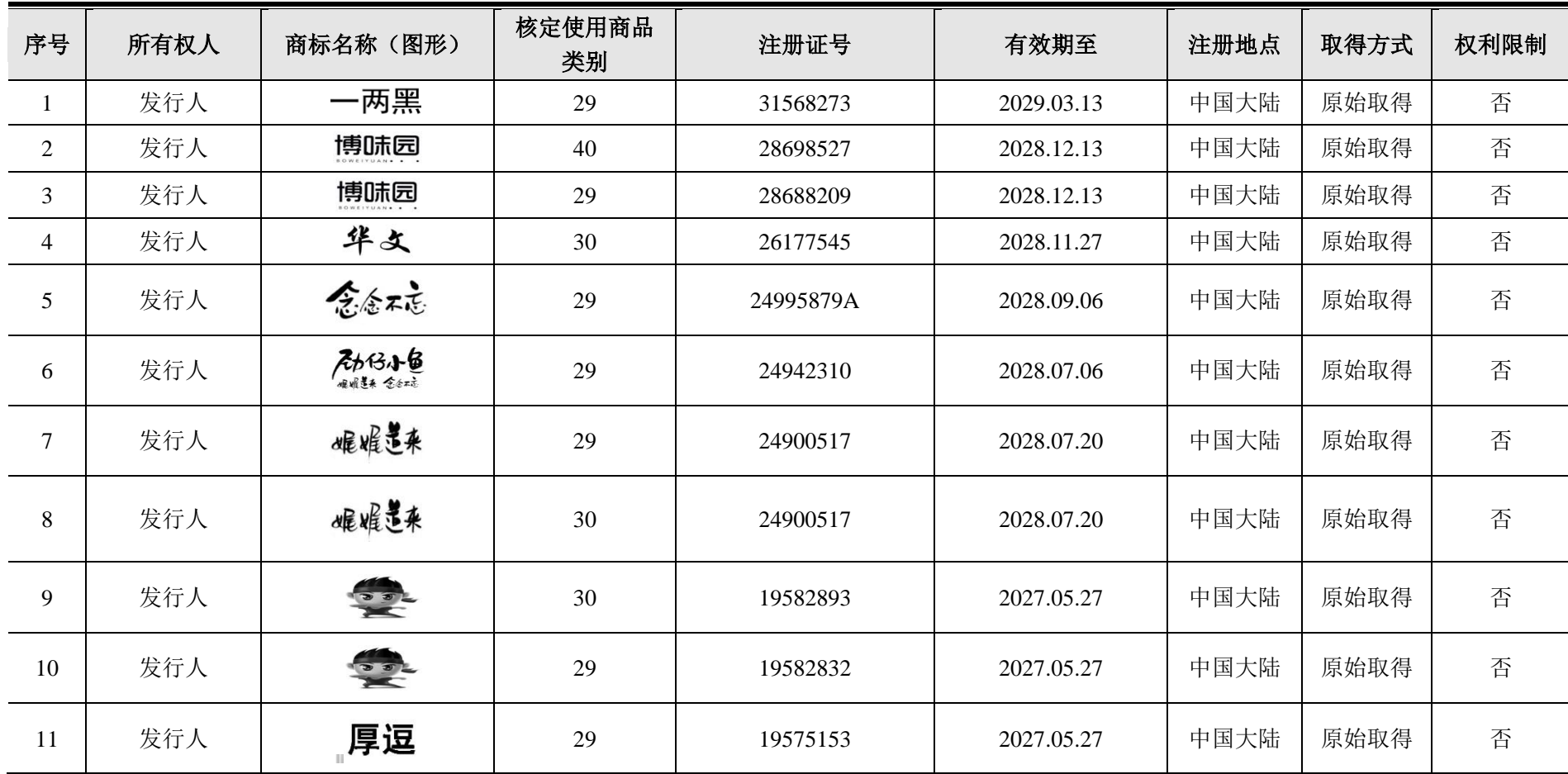
附件四：发行人及其子公司拥有的注册商标统计表