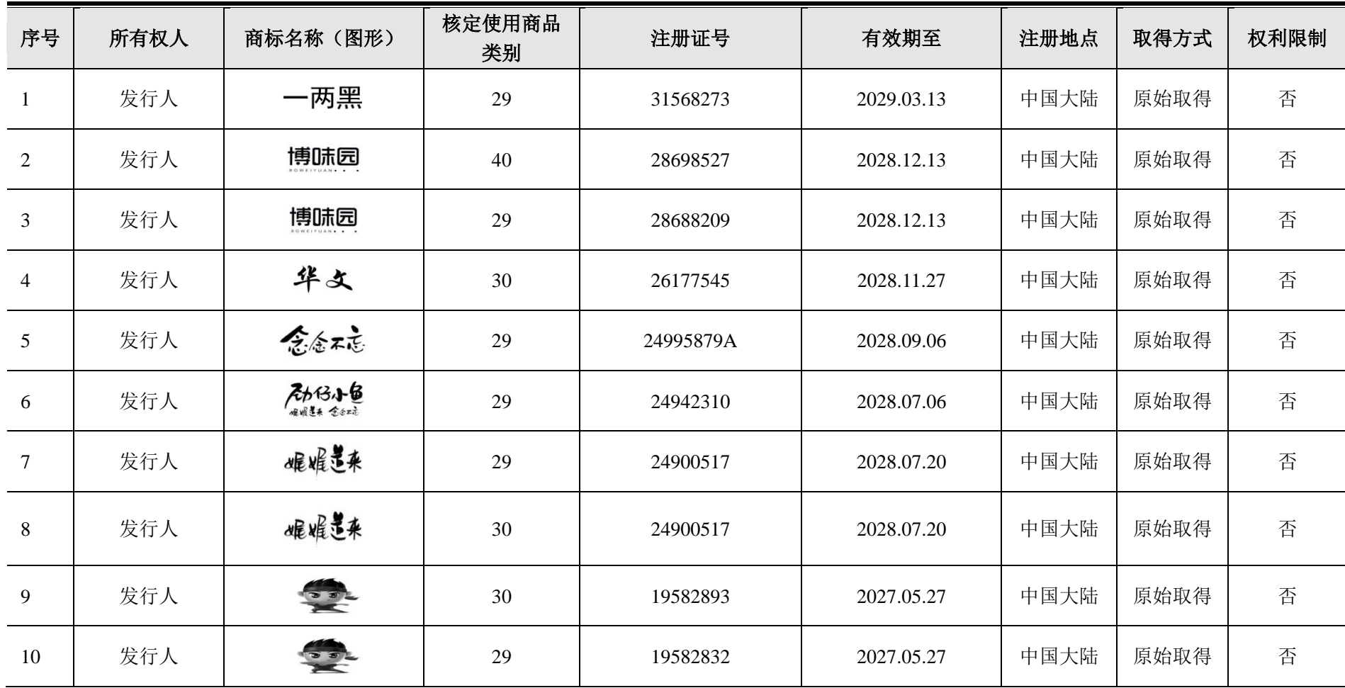
附件四：发行人及其子公司拥有的注册商标统计表