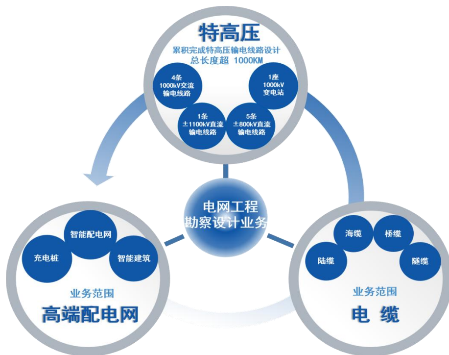
图3 永福股份电网工程主要勘察设计业务