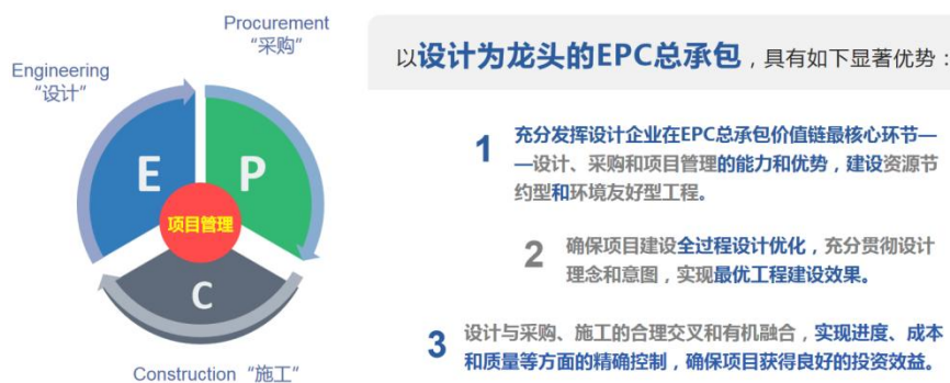
图 4 永福股份EPC总承包的显著优势

公司发展的总承包业务是以设计为龙头的EPC总承包管理模式，公司负责项目管理、设计、采购等核心环节，施工专业分包，可以充分发挥企业的显著优势。公司在EPC总承包领域具备业务类型全面、业绩丰富、管理理念先进、风控体系完整等综合优势，创新采用FEPC、DFEPC等多种国际商务模式和项目管理模式，总承包业务持续快速发展。