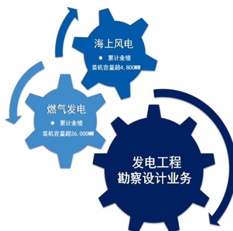
图2 永福股份发电工程主要勘察设计业务

公司重点发展国家提倡的燃气发电和海上风电等清洁能源及新能源发电业务。在燃气发电领域是国内少数具有世界主要燃机供货商（GE、SIEMENS、ANSALDO）各主力重型燃机机型设计业绩的电力设计企业，业务遍及东南亚、中东等多个国家，具有大量海外工程勘察设计经验和较强的海外项目执行能力；公司将海上风电业务作为公司战略发展方向之一，加大技术研发力度，引进欧洲最先进的海上风电技术，携手Ramboll、SPT等国际一流公司，致力于海上风电技术革新，综合能力在国内名列前茅。