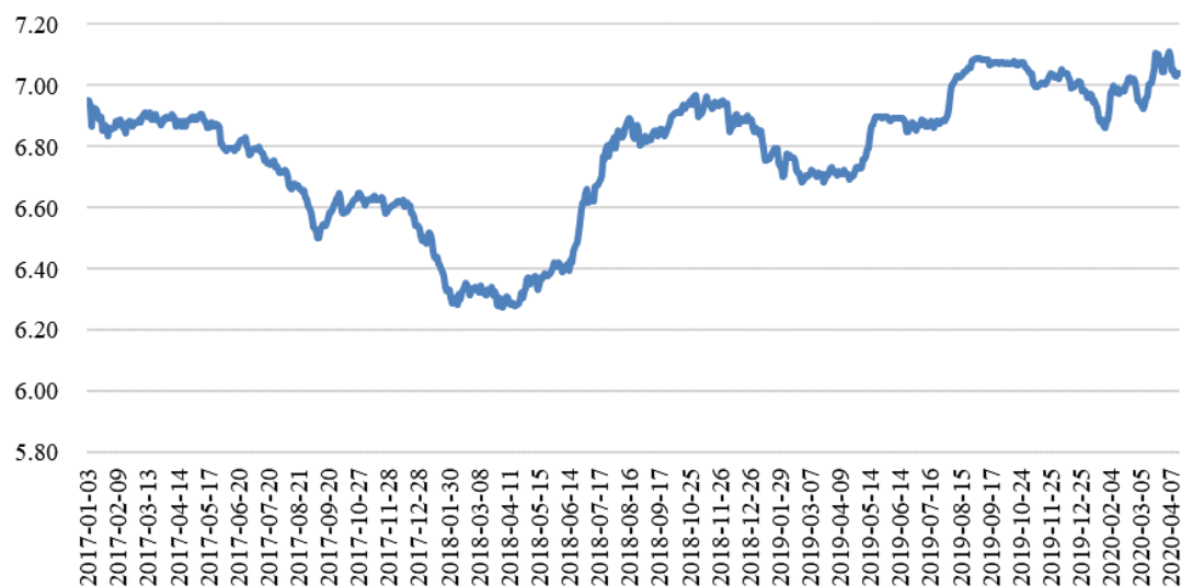
报告期内美元对人民币汇率中间价走势图

整体呈上升趋势，公司汇兑损失较 2017 年有所减少；2020 年 1-3 月，美元兑人民币汇率整体上继续上升，公司产生汇兑收益。公司汇兑损益的变化与美元汇率波动的趋势基本一致。