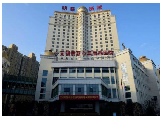
图 7: 无锡明慈心血管病医院有限公司