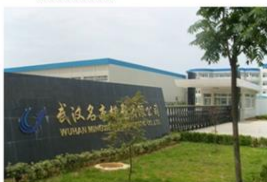
图 3: 武汉名杰模塑有限公司