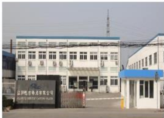
图 5: 江阴德吉铸造有限公司