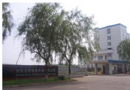
图 4: 沈阳名华模塑科技有限公司