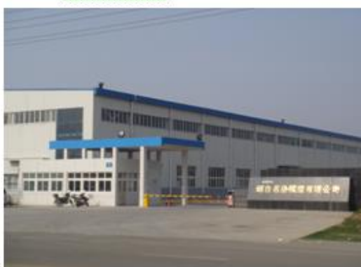
图 2: 烟台名岳模塑有限公司