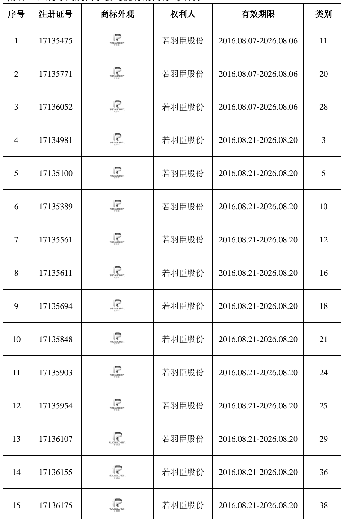
附件一：发行人及其子公司拥有的商标明细表