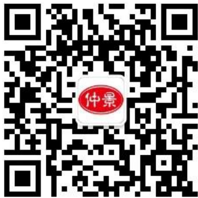
扫码关注官方微信公众号