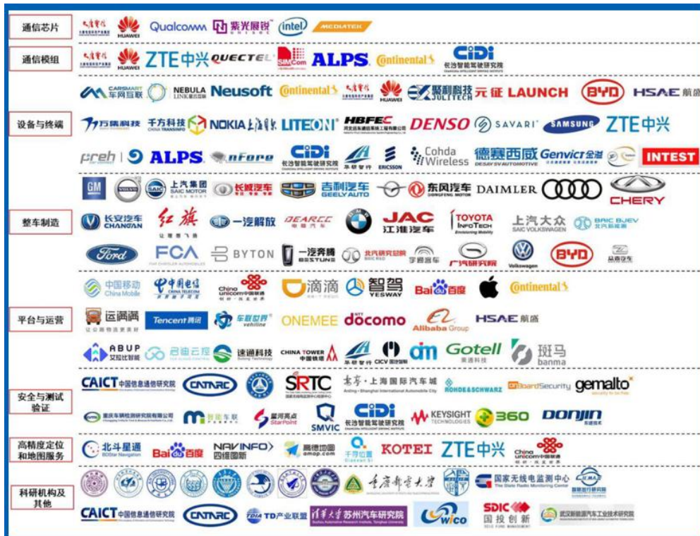
C-V2X产业地图

2019年10月22日，全球首次“跨芯片模组、跨终端、跨整车、跨安全平台”的 C-V2X 应用展示在上海汽车会展中心举行，该次实验展示由中国 5G 推进组 C-V2X 工作组、中国智能网联汽车产业创新联盟、中国汽车工程学会等牵头，聚集了整车企业（一汽、上汽、东风汽车、宝马、奥迪等 20 余家中外车企），芯片模组厂商（华为、中兴、大唐、国汽智联等 30 余家）、终端设备提供商（华为、万集科技等）、安全厂商和位路服务提供商参与验证，验证了国内 C-V2X 全链条技术标准能力，展现了国内 V2X 企业在全局的引领地位。“跨芯片模组、跨终端、跨整车、跨安全平台”，意味着我国已经形成包括通信芯片、通信模组、终端设备、整车制造、运营服务、测试认证、高精度定位及地图服务等为主导的完整 C-V2X 产业链生态。