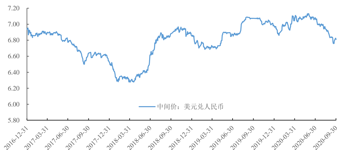
美元兑人民币汇率走势