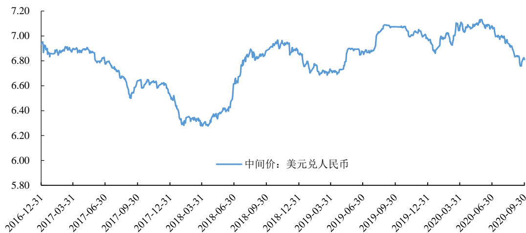
美元兑人民币汇率走势