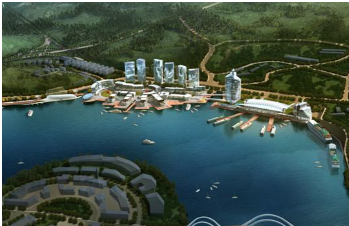
图：三峡游轮中心设计效果图