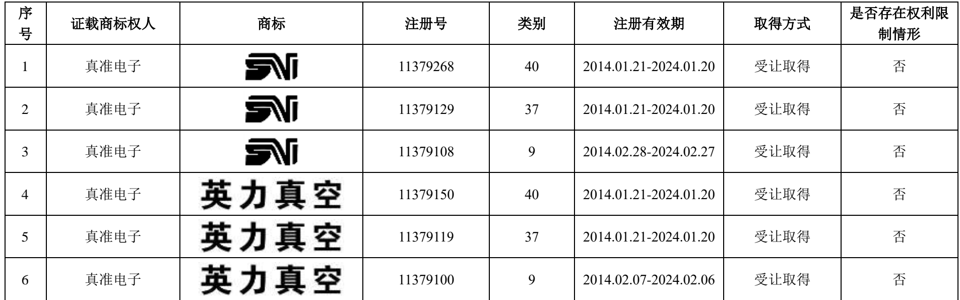
附表四：公司及其下属子公司拥有的商标情况一览表