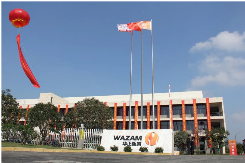
（华正新材青山湖基地）

公司所从事的覆铜板材料、功能性复合材料、交通物流用复合材料以及能源材料等新材料产品被广泛应用于通讯信号交换系统、云计算储存系统、自动驾驶信号采集系统、物联网射频系统、医疗设备、轨道交通、新能源、绿色物流等各大领域。公司荣获中国驰名商标、国家高新技术企业、中国印制电路行业优秀民族品牌、绿色工厂等称号，并建有浙江省企业技术中心、浙江省企业研发中心、浙江省企业研究院、浙江省博士后工作站；2020 年 12 月，华正新材技术中心成功入选 2020 年（第 27 批）国家企业技术中心。