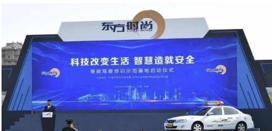
图为：智能驾驶培训示范基地启动仪式现场

紧抓科技引领的主动权，通过科学的态度和方法，将 VR、人工智能技术与 5G 网络应用于驾驶培训领域。2019 年 10 月，我公司正式启用 24 小时智能驾驶培训示范基地，开展新能源智能训练专属用车及全智能化驾驶培训。运用现代科技手段替代传统的教学方式，建立数字化、智能化、标准化的驾驶培训素质教育体系，把安全文明理念贯穿于整个驾驶培训全过程，打造更加科学、合理、系统的驾驶培训新模式，引领驾驶培训行业朝着科技化、智能化的方向发展。