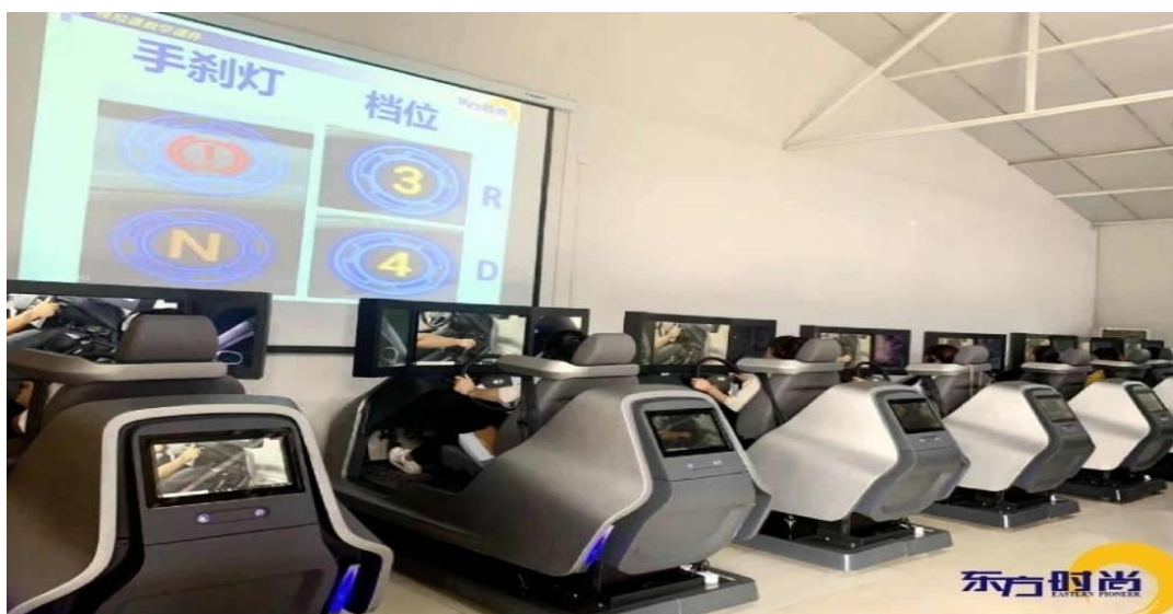
图为：沉浸式全路况 4DVR 驾驶模拟器

一方面，引入 5G+VR 驾驶模拟器与智能训练车组合教学的全新模式，将给学员带来沉浸式的全新教学体验，为学员提供更加优质和科学的培训指导，有力的推动了应试教学向素质教育的转变，提升用户体验和满意度的同时，还可以有效提升培训效率和效果，提升合格率；另一方面，以科技赋能驾驶培训将降低驾驶培训对生态环境产生的影响，有利于节能环保，或可打破固有区位、场地及时间对驾培行业的限制，减少天气状况等因素的干扰，节约人力资源，降低驾培机构的安全风险等管理成本，提升企业竞争力。