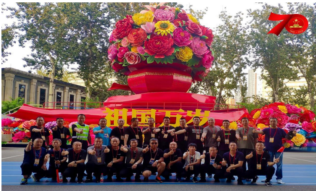
图为：东方时尚 70 周年国庆彩车指挥员（驾驶员）团队

在新中国成立 70 周年庆典活动中，我公司同 10 年前一样，再次被党和国家委以重任，承担并圆满完成了彩车驾驶员培训及高难度彩车驾驶的光荣政治任务。任务结束后，彩车团队组建了爱国主义宣讲团，分批走进东方时尚全国各子公司，结合“不忘初心，牢记使命”主题教育活动，将此次国庆彩车保障任务中所焕发出的爱国热情与尽责精神传递给更多的东方时尚人，公司凝聚力持续提高。