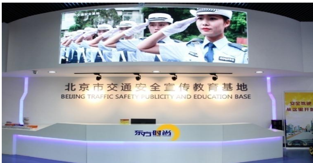
图为：北京市交通安全宣传教育基地

公司成立北京市交通安全宣讲团，先后走进机关、学校、企事业单位及社会团体进行有针对性的交通安全专场宣讲，受益群体不断扩大。宣讲团不仅在北京开展交通安全宣讲活动，2019年起，开始走进全国更多的学校，为学生群体带去交通安全知识，帮助他们树立安全文明交通意识，掌握安全出行的自我防护知识。