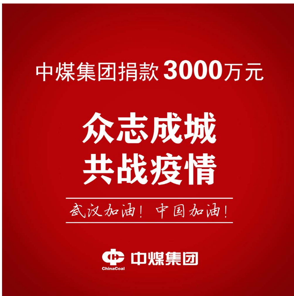
中煤集团捐款3,000万元支持战疫

紧急驰援疫线： 2020年1月31日，母公司（中煤集团）第一时间向湖北疫情防控一线捐款3,000万元，助力湖北抗击疫情；公司广大干部职工捐款624万元；向地方政府、定点扶贫县和国内外合作伙伴捐赠多批防疫物资。公司所属医院累计接诊发热患者800余人次，抽调37名医务人员支援湖北和当地疫情防控工作。