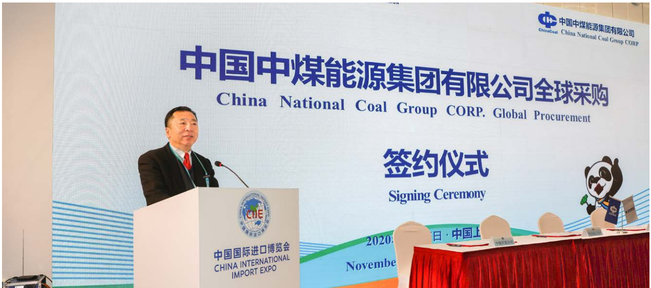
中煤能源参与第三届中国国际进口博览会

个方面的具体工作措施。加强总法律顾问制度建设，公司所属重要子企业全部建立了总法律顾问制度，为企业合规经营提供了有力支撑。