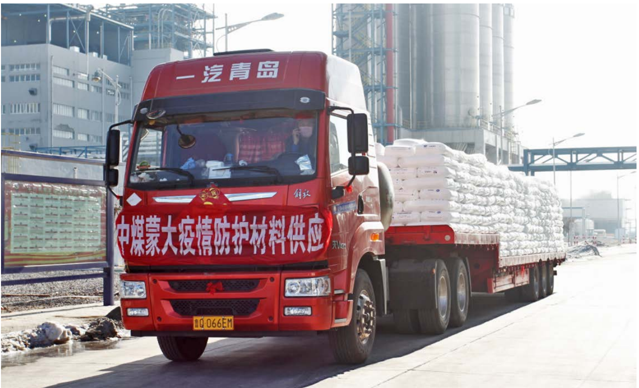
中煤蒙大化工公司紧急转产疫情防护材料

转产医用物资： 疫情发生以来，公司围绕大局担当尽责，不惜代价、分秒必争，统筹协调所属煤化工企业改造转产，全力以赴做好疫情防控一线重点医疗防控物资保障工作。内蒙古中煤蒙大新能源化工有限公司紧急转产医用防护服和口罩原材料，半个多月时间生产出15,000吨聚丙烯材料，全部运抵医用无纺布生产工厂，打响了“产得出、运得快”的中煤效率。中煤鄂尔多斯能源化工有限公司、中煤陕西榆林能源化工有限公司等煤化工企业闻令而动、勇挑重担，开足马力、抢抓生产，全力保障春耕备耕物资、生产生活物资供应，充分发挥了中央企业主力军、国家队作用。2月22日，中央电视台《新闻联播》《朝闻天下》一天内两次报道中煤能源战“疫”保供。