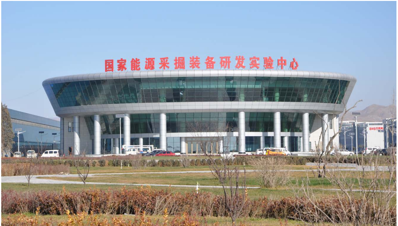
国家能源采掘装备研发实验中心

公司不断构建开放合作创新模式，分别与中国煤炭科工集团、中国矿业大学（北京）、安徽理工大学、武汉理工大学等一流高等院校和研究机构签订开展高层次合作协议，建立全面战略合作伙伴关系；加入了“煤矿智能化技术创新联盟”、“中国矿业知识产权联盟”。