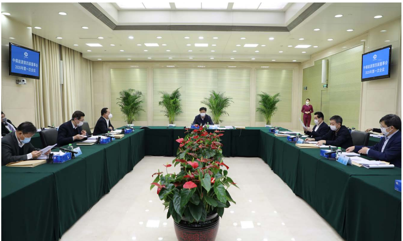
中煤能源董事会会议

依法治企。 公司秉承依法治企、合规经营理念，全面打造依法治企的企业法人、诚实守信的经营实体、公平竞争的市场主体，模范遵守国家法律法规和政府监管规定，积极维护企业信用。公司制定了《中煤能源依法治企工作方案》，提出了建立法律风险管理标准、加强公司合规管理工作、深入推动法律管理体系、全面提升依法治企能力等四