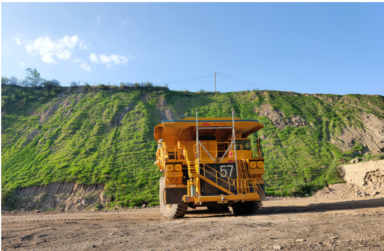
中煤平朔露天矿首台无人驾驶卡车测试成功

煤矿智能化建设成效突出。制定印发煤矿智能化建设指导意见，加大技术攻关与工程实践力度，提升中煤特色智能化关键