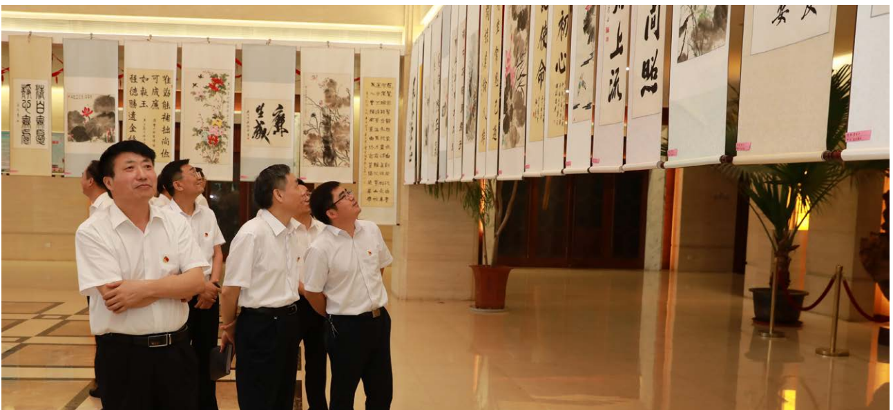
上海能源公司开展廉洁教育活动

透明运营。 公司坚持透明运营，针对员工和社会关注的招聘、采购、招标、干部任用等热点问题，坚持计划公开、过程公开、结果公开，接受社会监督，杜绝暗箱操作。坚持厂务公开制度，通过职代会、公告栏、意见箱等方式，定期公开企业重大事项、领导干部职务消费情况、资产财务情况，鼓励员工建言献策、参与企业管理。公司每年通过企业网站、微信公众号、报纸、社会责任报告、企业年报等媒介和载体，及时公布公司经营发展情况，加强ESG信息披露，主动回应社会关切。公司与利益相关方建立了良好的沟通机制，以热线电话、电邮及传真等途径，解答和倾听投资者的疑问与意见，提高公司运营透明度。