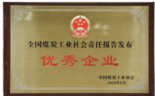
“全国煤炭工业社会责任报告发布优秀企业”奖牌

加强社会责任沟通。 从2009年发布第一份社会责任报告起，中煤能源至今已连续12年发布社会责任报告，两次获得“央视财经50指数·十佳社会责任公司”荣誉。2020年，中煤能源、上海能源荣获“全国煤炭工业社会责任报告发布优秀企业”荣誉。