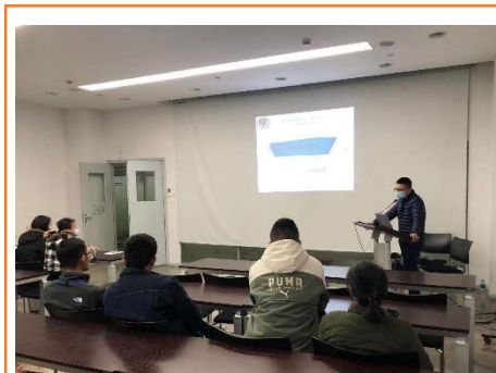
2020年12月，上海复旦张江邀请上海市浦东新区医疗急救中心对员工开展急救知识普及培训，介绍急救目的、各类场景及处理方式。

我们执行三级培训制度，包括公司级（一级）安全教育、车间或部门（二级）安全教育、工段或班组（三级）安全教育，受教育者在接受安全生产教育培训并考核合格后方能上岗。对于从事受压容器工、电气工、高配工、计量、车辆驾驶员等特殊作业人员，本集团要求由专业主管部门进行专门技术培训，在考试合格并获得专业主管部门的认可后，方能进行特种作业操作。