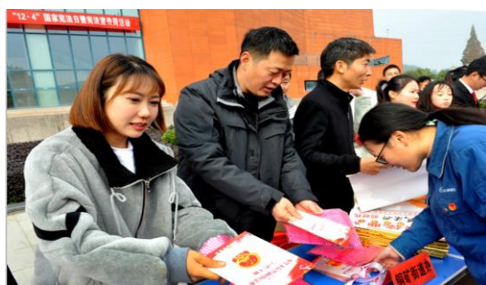
宪法宣传周，公司员工积极领取手册

2020 年 12 月 4 日是第七个国家宪法日，为深入学习宣传习近平法治思想、党的十九届五中全会精神、《中华人民共和国宪法》《中华人民共和国民法典》疫情防控以及证券期货市场法律法规，在全公司范围内开展了 2020 年“宪法宣传周”活动。为增强宣传实效，同时结合当前疫情防控需要，避免人员过度集中，公司创新宣传形式，通过线上与线下相结合的方式开展宣传学习活动。各单位纷纷行动，积极响应，营造浓厚的法治氛围。