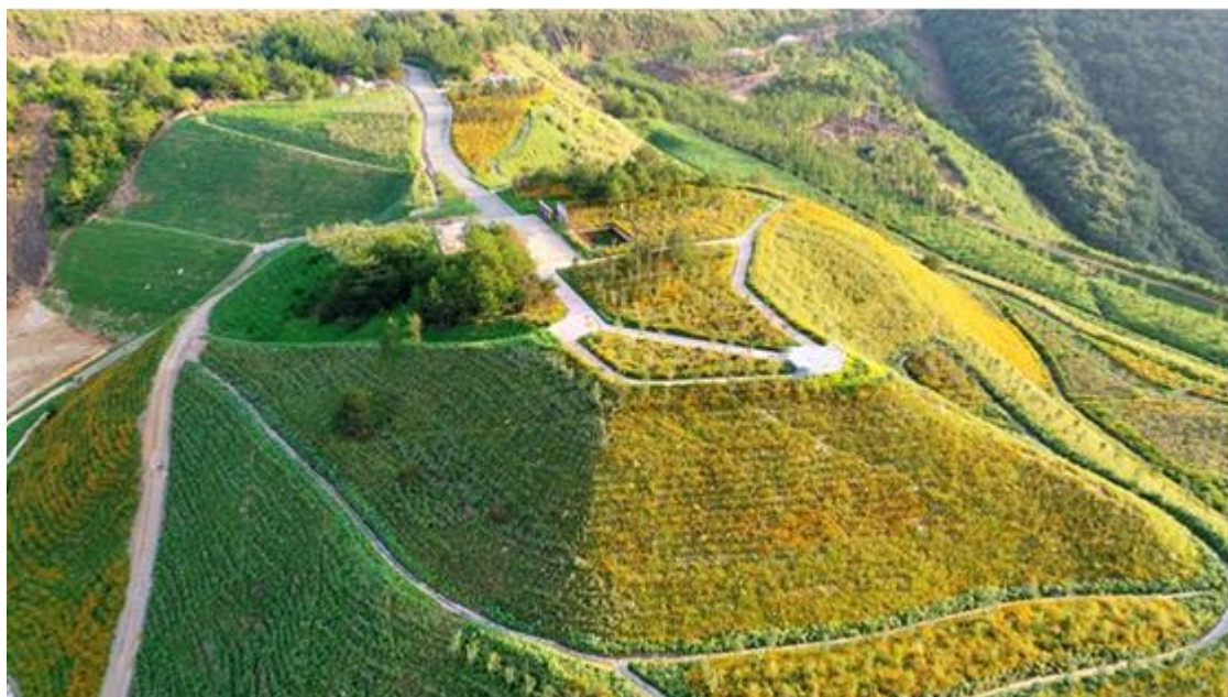
杨桃坞废石场生态修复后