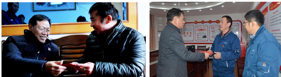
江西铜业春节送温暖帮扶行动