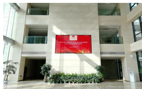
电子屏幕放映宪法宣传周活动