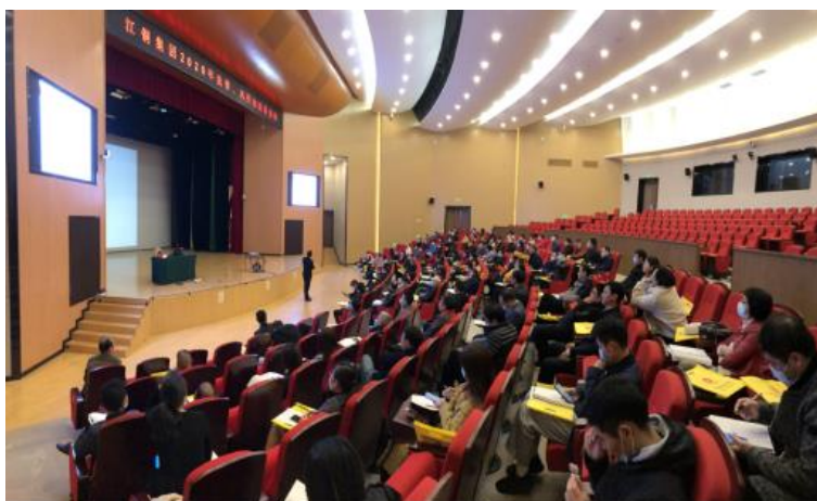
公司员工在法律学习培训班听讲座