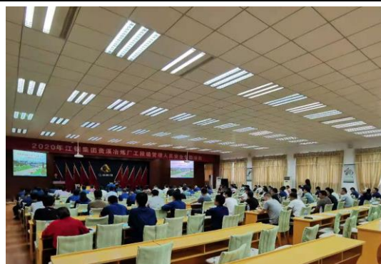
2020 年贵溪冶炼厂安全培训

截止 2020 年 12 月 31 日，公司拥有安全生产标准化证书 41 个，其中二级安全生产标准化证书 31 个，三级安全生产标准化证书 4 个，其中，2020 年新增安全生产标准化证书 2 个。