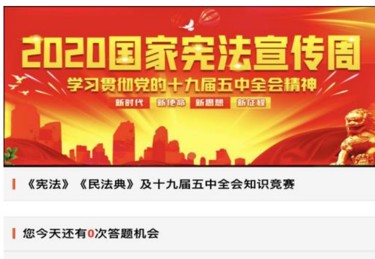
公司线上知识竞赛页面

受今年年初以来的疫情影响，今年“宪法宣传周”活动的开展与往年有所不同。为防止人员集中带来的疫情防控压力，此次“宪法宣传周”创新宣传形式，新增线上知识竞赛活动。此次线上知识竞赛由公司工会牵头，于 12 月 3 日至 8 日，依托“江西铜业 E 家亲”微信平台，组织开展线上知识竞赛活动。本次知识竞赛主要以线上答题方式进行，答题考察内容主要包括：《中华人民共和国宪法》《中华人民共和国民法典》以及中国共产党第十九届中央委员会第五次全体会议精神。此次线上知识答题竞赛吸引了员工的积极参与，每天都可登录参加线上答题，并赢取现金红包奖励。参与者皆表示此次知识竞赛既提高了对宪法及民法典的认识，也增强了对十九届五中全会精神的学习。