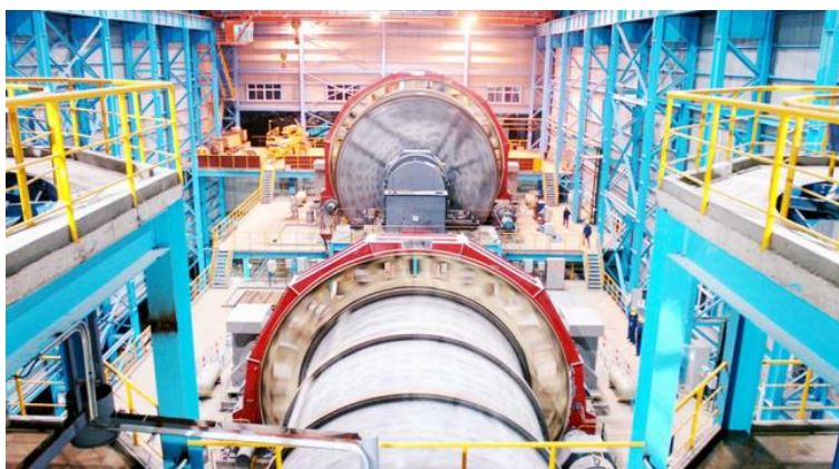
江西铜业复产复工进行时

在疫情防控常态化背景下，公司开启“智慧复工”的新模式，积极采用远程办公、视频会议等信息化手段，保证了对外商务联系不中断，对内办公效率高速运转。公司及下属企业充分运用大数据、云计算、物联网等新一代智能技术优势，破解疫情带来的生产难题。江铜国际贸易有限公司开通了 ERP 家庭办公专线，员工在家就可以通过 VPN 连接公司的共享文件夹，完成业务操作；江西铜业材设公司运用采购电子商务平台，实现采购寻源、网上采购、合同签订、到货验收、仓储、出库等，供应业务全流程全程线上完成；江西铜业物流公司依托车联网平台，提供“智慧供应链”管理服务。旗下 330 台内部倒运工程机械及重型车辆成功实现智能物联，在疫情防控的形势下，通过集约整合和科学调度，实现 24 小时待命接单。