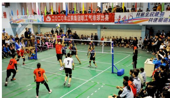
2020 年职工气排球比赛

年，公司开展公司级体育赛事 17 项，二级单位举办各类文体活动 120 场，吸引 17033 人次参与。