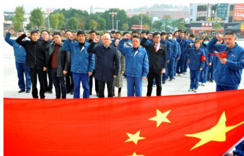
公司党员集体宣誓