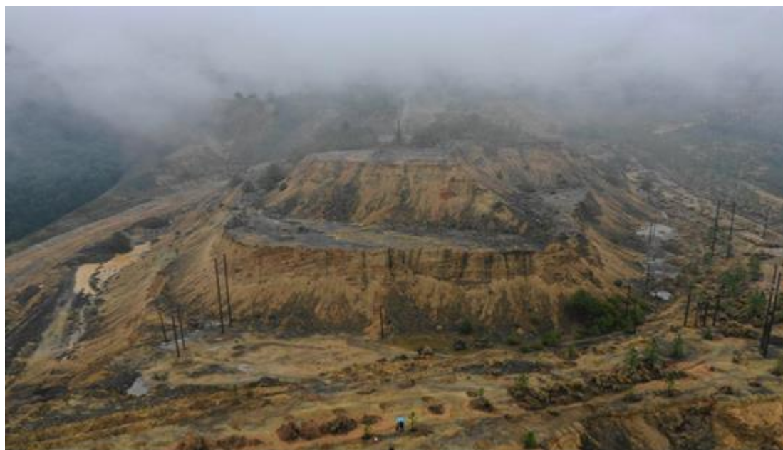
杨桃坞废石场生态修复前原始图片

环保设施的建设一如既往地得到了公司的高度重视。德兴铜矿从 2015 年开始对杨桃坞废石场进行生态修复，采用原位修复等综合生态治理技术对废石场进行治理，实现了边坡稳定、清污分流设施完好、场地内土壤 pH 值提高到 5-7，建立免维护、不退化的植被系统，植被覆盖度稳定保持在 90% 以上，植物多样性达到 20 种以上；有效地控制了水土流失，大幅度改善了区域的生态环境。