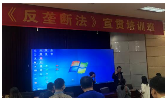
《反垄断法》专题培训