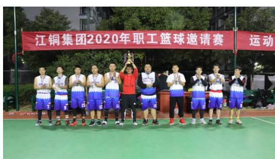
2020 年职工篮球邀请赛