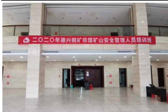
2020 年德兴铜矿非煤矿山安全管理人员考核培训班