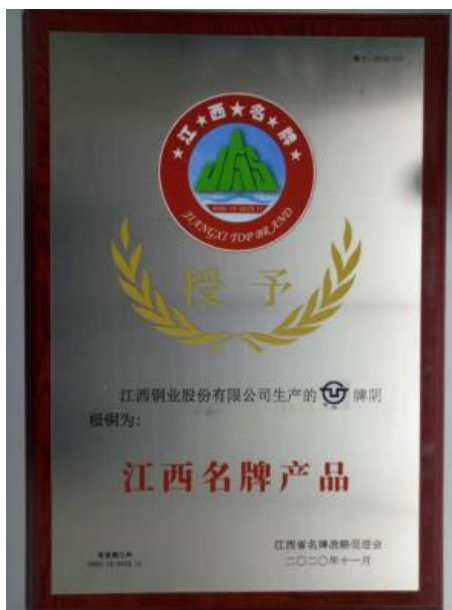
公司名牌产品-阴极铜

同时,截止 2020 年 12 月 31 日,公司共获得商标授权 159 项,新获得马德里国际注册商标:“江西铜业”“”及江西铜业图标三个注册商标。2020 年 11 月,公司生产的阴极铜荣获江西省名牌产略促进会授予的江西名牌产品的殊荣。