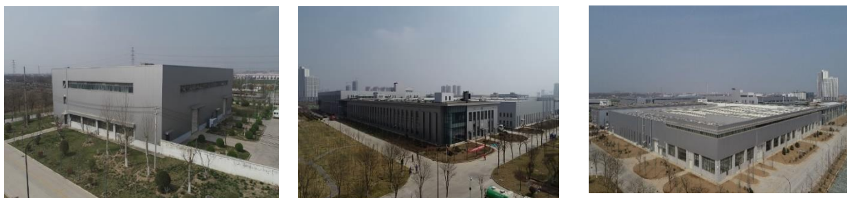
图：公司产业园厂房建设现场

四是深化精益管理，提升基础管理。运营大数据应用初见成效，数字化研发规模应用普及，制造数字化与装备履约全面加速，核心管理业务实现全面“线上跑”。推进体系效能型军工核心能力建设，制定数字化精密光学加工车间建设方案、数字化精密机械加工车间建设方案，产业链逐步从低端环节转向高端环节。统筹推进产业园建设，生产及辅助单元建筑工程基本建成，101#光电综合体具备使用条件、205#员工食堂即将完工投入使用。