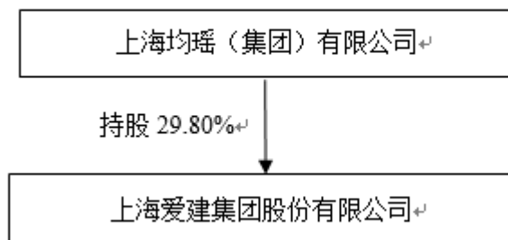
公司与控股股东股权关系方框图