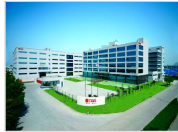
上海智慧能源产业园

公司始终以“ 掌握核心技术，不断创新 ”作为核心竞争力，坚持走自主创新道路，公司高度重视产品研发投入和研发综合实力的提升。公司是物联网无线自动抄表技术的倡导者、产业化推动者和行业标准制订者。参与起草了《无线远传膜式燃气表》、《阶梯水价水表》、《基于窄带物联网（NB-IoT）技术的民用智能燃气远传抄表系统》、《NB-IoT 水表》、《灌溉水表》、《热量表》以及《基于窄带物联网（NB-IoT）的智能水表抄表系统通用技术规范》等 20 余项标准的制定。公司是国家技术创新示范企业、物联网示范企业、物联网 100 强企业、电子信息行业标杆企业，在物联网技术、云计算技术、自动控制技术、大数据挖掘技术等领域处于行业内领先水平。