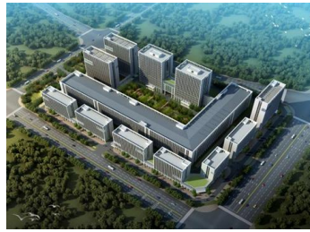
郑州5G物联网智慧产业园