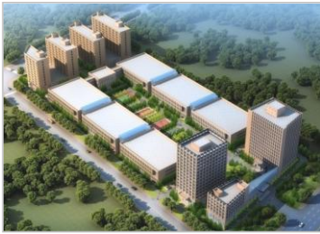
郑州智慧能源产业园

新天科技创建于2000年，注册资本11.75亿元，于2011年8月在深圳证券交易所创业板挂牌上市。公司主要业务为“智慧水务、物联网智能表、工商业智能流量计、智慧农业节水、水务信息化管理软件以及互联网云平台服务”等物联网综合解决方案。公司产品覆盖全国600多个区域，并远销印度、俄罗斯、土耳其、尼日利亚、马来西亚、澳大利亚、迪拜、蒙古、印尼等国家。