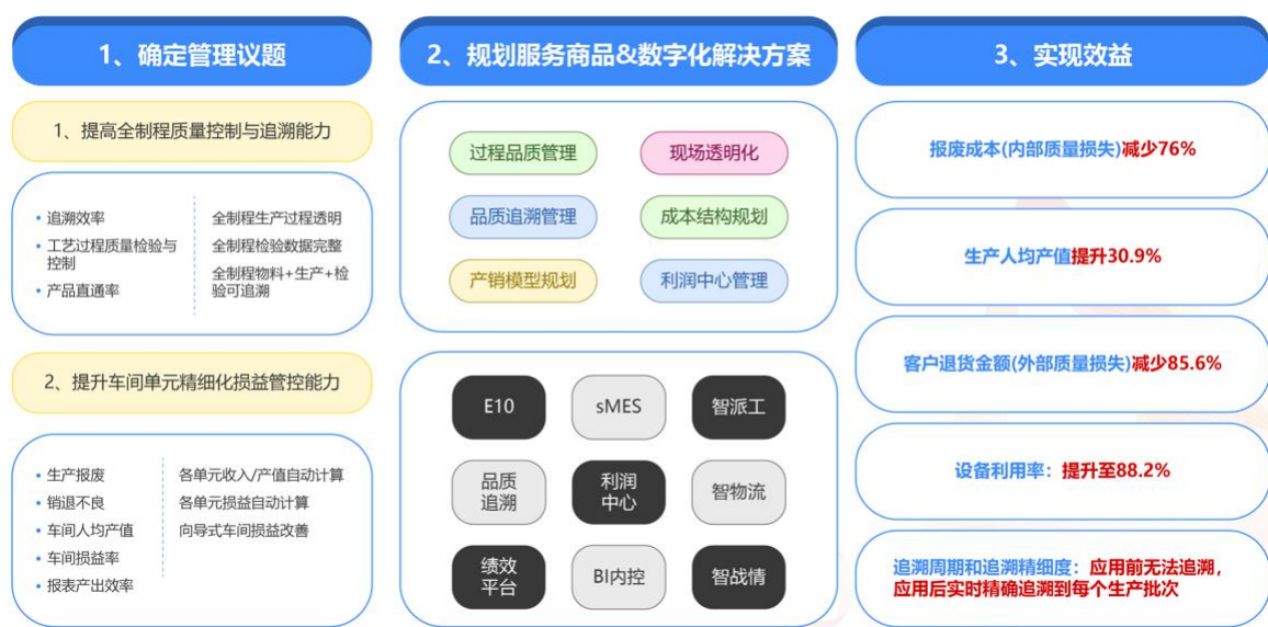
图1：服务商品应用于某光电子企业的数字化改造流程及效果

在某光电子企业的数字化解决方案改造中，鼎捷软件通过现场透明化、产销模型规划、过程品质管理、品质追溯管理、利润中心管理等议题规划，解决了客户产品质量的可靠性与可追溯性效率低，车间人均产值提升困难，设备利用率难以把控等问题。最终，企业的产品质量追溯效率大幅改善，良品率快速提升，人均产值提升31%，综合效益大幅提升。客户数字化项目改造的成功，极大的增强企业持续数字化转型投入的信心与决心。