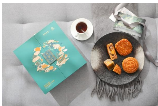
陶陶居“可听月”月饼