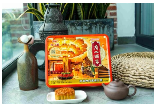
双黄纯白莲蓉月饼