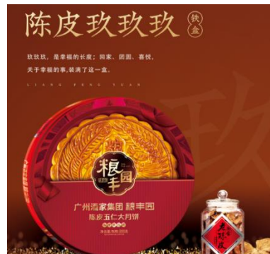
粮丰园陈皮五仁大月饼