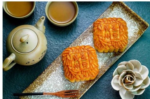
蛋黄果仁豆沙月饼