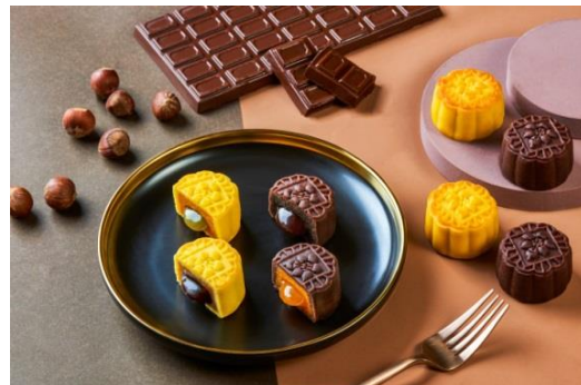
巧克力榛子流心月饼