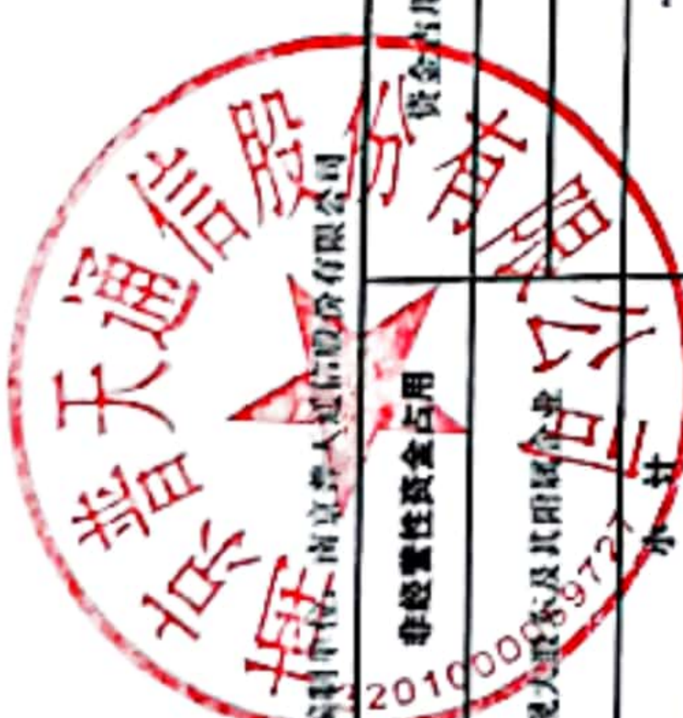
非经营性资金占用及其他关联资金往来情况汇总表