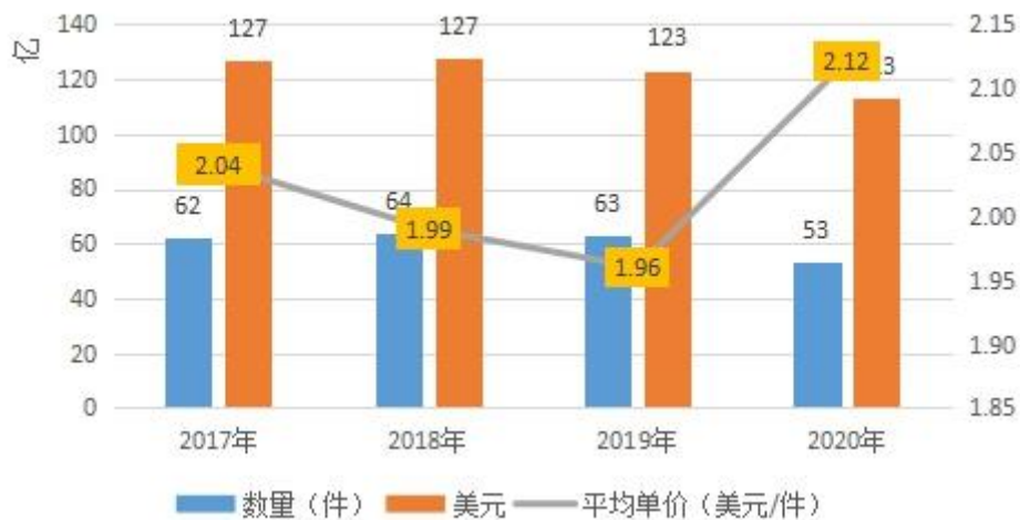
无缝服饰近四年出口数据

从无缝服饰出口市场来看，2020年我国共出口53.3亿件，同比下降15.2%，出口金额为113亿美元，同比下降8.2%，平均单价同比上升8.2%。