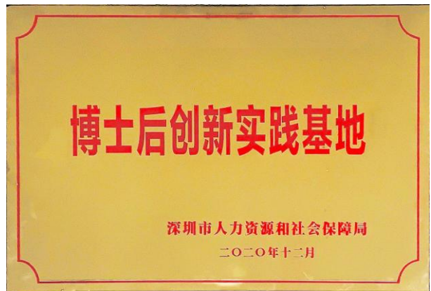
图 5-4 博士后创新实践基地

在人才专业培养方面，我司注重核心团队的打造和培养，通过采用一系列科学的评估工具，不断挖掘各类高潜人才，并为高潜人才制定中长期的学习培养计划。在员工素质培养方面，我司共举各类讲座、培训 50 余次，大大提升了员工整体素质和工作效能。在绩效管理方面，我司与上海天强咨询管理有限公司合作，重新梳理了公司组织架构并制定结合 2020 年实际情况制定各业务板块的“关键指标”和“关键任务”。既保证了我司长期目标和短期目标的顺利达成，又为人才“选、用、育、留”提供了一系列的科学依据。同时为简化人力资源工作流程，提升工作效率，我司引进了“金蝶软件”专业的人力资源系统，使人力资源部门职能更多地倾向管理角色。