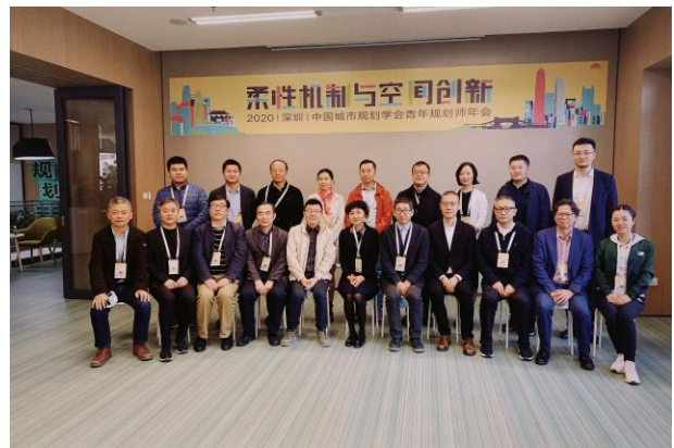
图 5-2 中国城市规划学会青年规划师年会