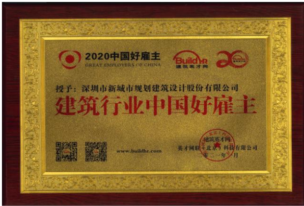
图 5-3 2020 中国好雇主