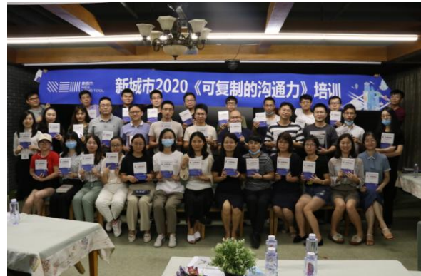
图 5-6 《可复制的沟通力》培训活动