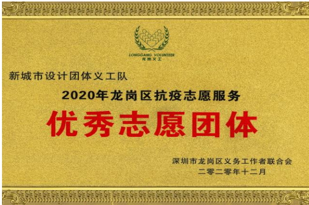
图 6-1 2020 龙岗区抗疫志愿服务优秀志愿团体

的形式，为四川凉山彝族自治州德昌县巴洞镇裕民小学的孩子们，送去温暖与关爱。无论是经营企业，还是为善布施，公司都以实际行动书写上市企业的责任与担当。