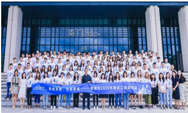
图 5-5 2020 新员工培训活动

在人才专业培养方面，我司注重核心团队的打造和培养，通过采用一系列科学的评估工具，不断挖掘各类高潜人才，并为高潜人才制定中长期的学习培养计划。在员工素质培养方面，我司共举各类讲座、培训 50 余次，大大提升了员工整体素质和工作效能。在绩效管理方面，我司与上海天强咨询管理有限公司合作，重新梳理了公司组织架构并制定结合 2020 年实际情况制定各业务板块的“关键指标”和“关键任务”。既保证了我司长期目标和短期目标的顺利达成，又为人才“选、用、育、留”提供了一系列的科学依据。同时为简化人力资源工作流程，提升工作效率，我司引进了“金蝶软件”专业的人力资源系统，使人力资源部门职能更多地倾向管理角色。