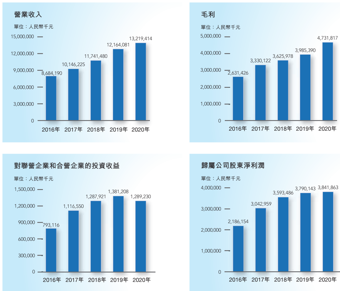
主要經營業績指標對比表

截至2020年12月31日止年度，本集團實現營業收入人民幣 132.19 億元，較上年同期增加人民幣 10.55 億元，增幅為 8.7% ，主要是液體散貨處理及配套服務板塊、金屬礦石、煤炭及其他貨物處理以及配套服務板塊收入增加。