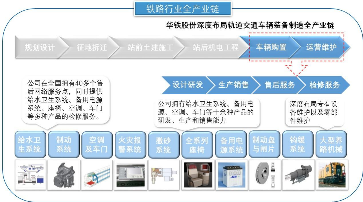
图2-2 轨交核心零部件大平台业务模式示意图