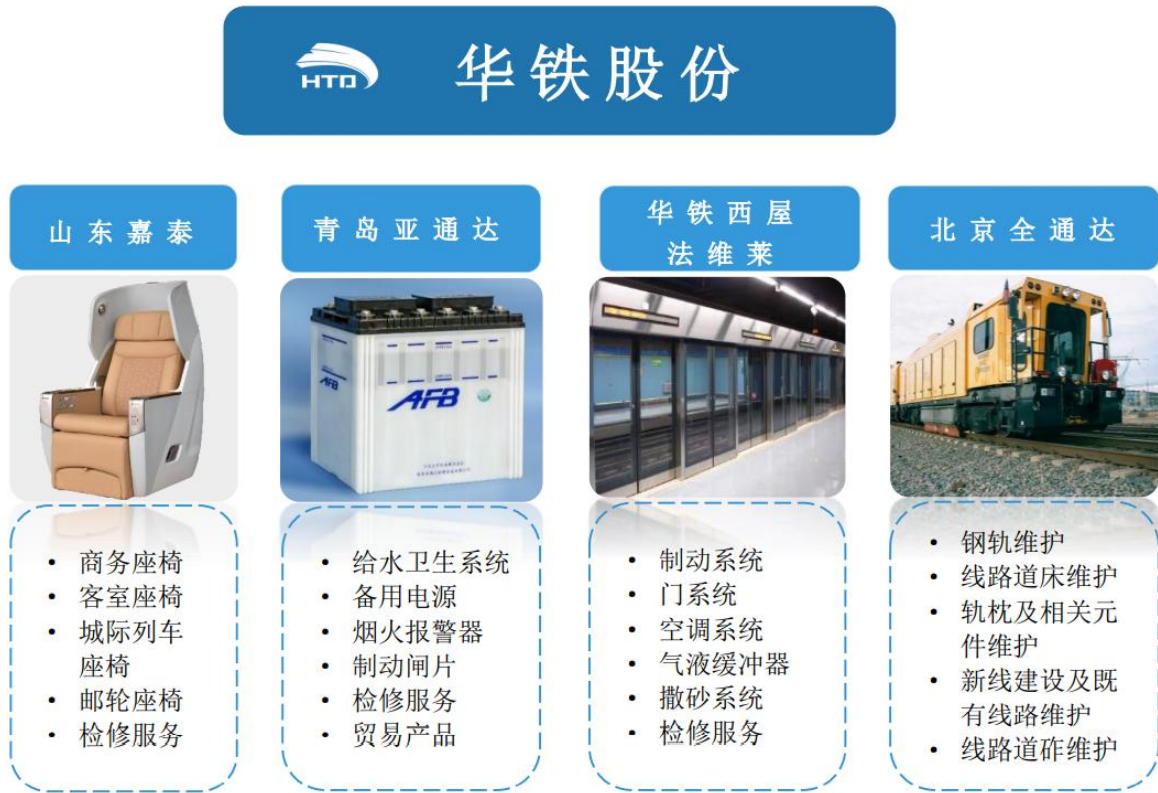
图3-1 公司主要的业务架构图